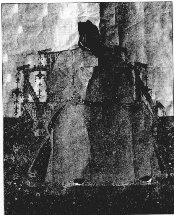
朱元璋，西藏自治区拉萨市布达拉宫藏。