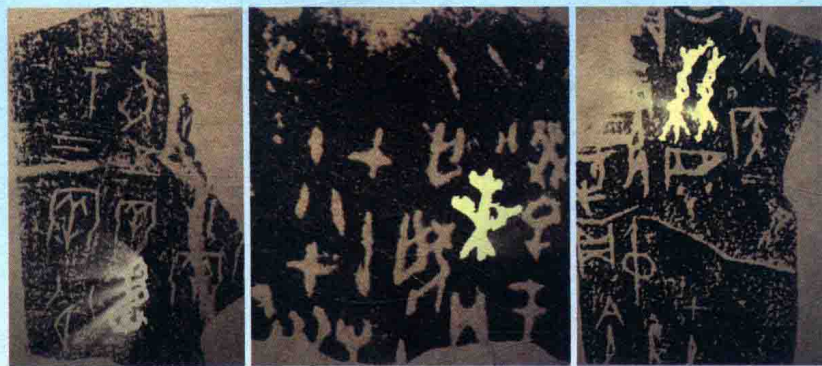
在中国现存最古老的文献甲骨文中，已经出现了诸如“蚕”“桑”“丝”之类的字样。

也正是在托勒密的时代，西方人才最终知道，那个被他们称为“赛里斯”的国度，就是——中国。