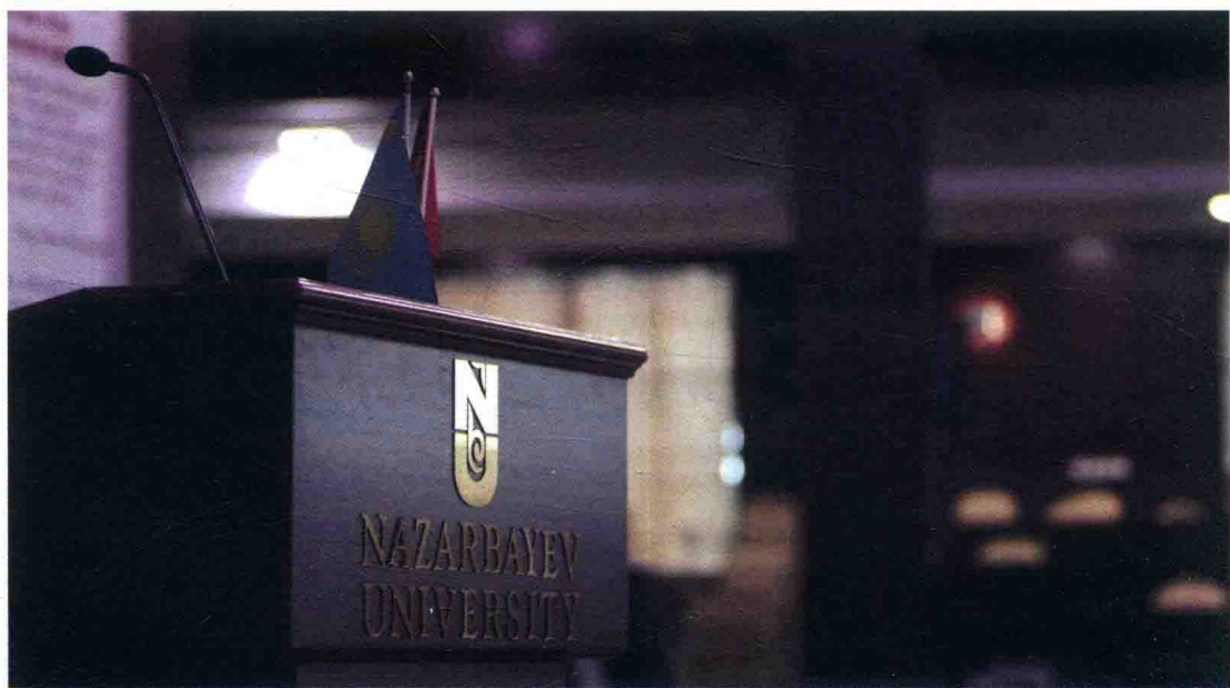
纳扎尔巴耶夫大学

哈萨克斯坦，这个位于亚洲腹地的内陆国家，是古丝绸之路经过的地方，曾经打造了阿拉木图、塔拉兹、希姆肯特等众多商旅往来和贸易的重镇，为沟通东西方文明做出过重要贡献。