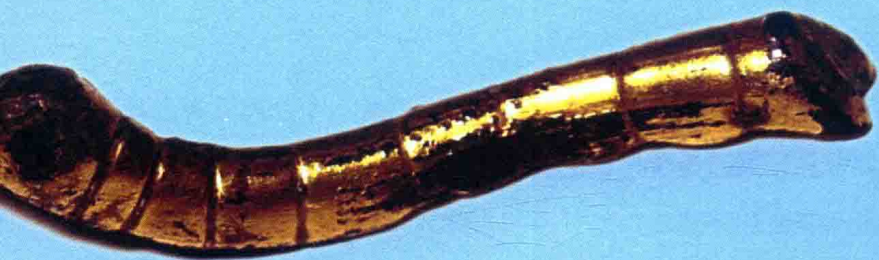
中国陕西历史博物馆 珍藏的鎏金铜蚕

古城西安的陕西历史博物馆，珍藏着一件特殊的文物——鎏金铜蚕。虽然鎏金已多处脱落，但铜蚕依然首尾完整，形体饱满，呈昂头吐丝状。它出土于陕南石泉县，年代为西汉时期，距今已有两千多年。