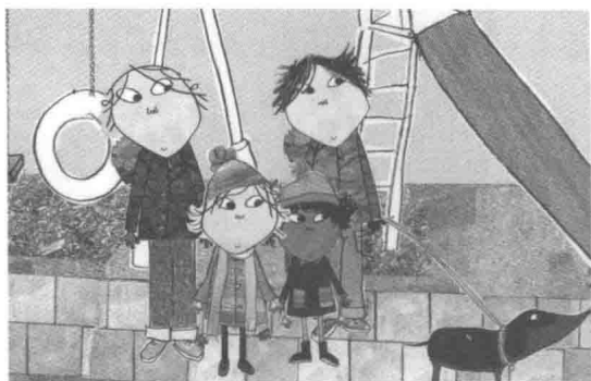
图7 动画系列片《查理与劳拉》采用拼贴材料的元素展现了丰富的色彩与质感