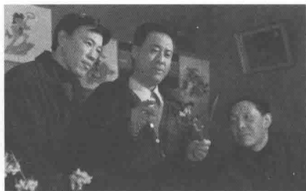
图4 动画影片《哪吒闹海》导演们在商议角色最终在赛璐珞上的呈现效果(1978)