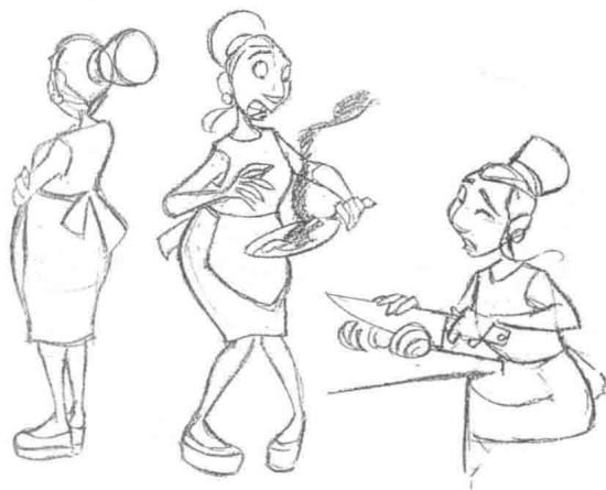
图5 法国动画片《Wheeler》妇人角色造型

随着影片的美术风格（艺术格调）的确立，动画角色造型的美术风格也基本尘埃落定。在更为具体的角色造型创作中，造型设计师会更为深入地探索造型风格在绘画上的“形式感”，以更为完美地整体贴合影片的美术风格（图7、图8）。