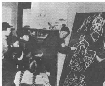
图3 上海美影厂《骄傲将军》摄制组正在讨论影片的角色造型设计