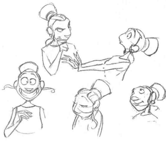
图6 动作造型及脸部表情图