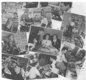
图2 早期迪士尼团队的动画片制作 每个步骤都必须井然有序地开展

原画和动画是动画影片中“角色”表演和动态呈现最重要的工作之一。动画片中的所有“角色”从头至尾的每个动作、每个表情、每句台词,都是需要靠原动画设计师们创作绘制出来的。动画制作过程必须要求有一个最终的角色设定稿提供给几十个原画师和更多的动画师,他们才能开始工作,才能保证角色在影片中完美出色地表现(图4)。