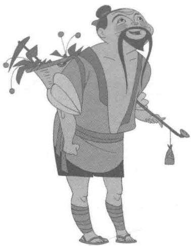
图10 动画电影《马兰花》中小兰大兰的爸爸的色彩设定