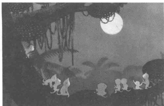
图8 剪纸动画《水中捞月》借鉴了中国传统剪纸工艺的特点