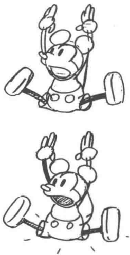
图1 迪士尼早期米老鼠的造型

前期为设定创作期，内容有：文字剧本、美术风格设计、角色人物造型设计、色彩指定、场景设计、分镜头本、摄影表动作编写。而动画角色设计又包括以下几个方面：美术设计、概念稿、设计稿、原动画设计、校对、分期合成、台本设计（见表一、表二）。