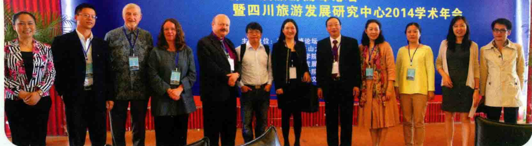
与会学者在主会场合影