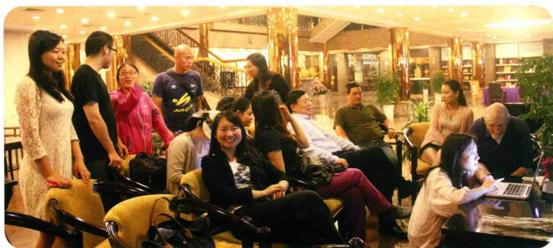
格拉本教授的“席明纳”(Seminar)