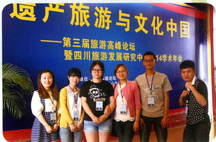
青春活力的会务组