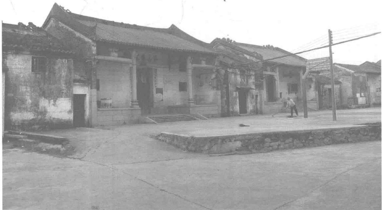
图 1-1 1883 年 11 月 24 日，陈耀垣出生于广东香山黄梁镇南山村（今珠海市斗门区乾务镇南山村）。图为南山村陈氏宗祠。

On November 24, 1883, Chan Yew Foon was born in Nanshan village, Xiangshan (now Doumen, Zhuhai), Guangdong. The photo shows the Chan ancestral temple in Nanshan.