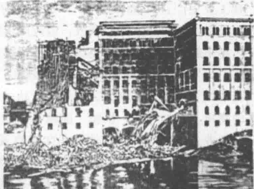
图 0-4 德国面粉厂爆炸