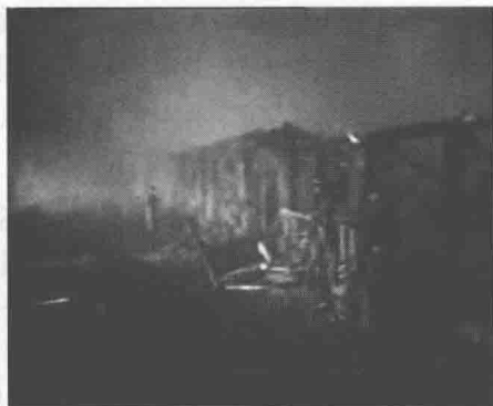
图 0-5 哈尔滨亚麻厂粉尘爆炸