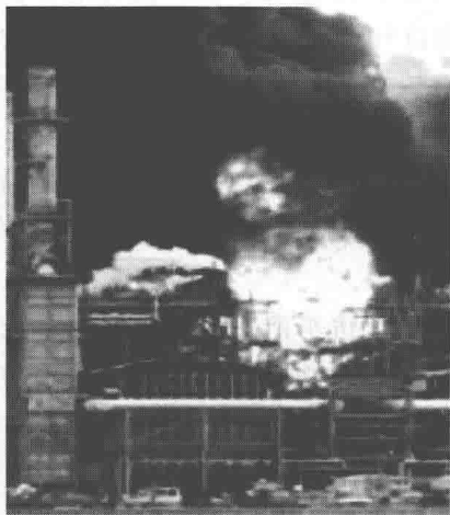
图 0-1 美国聚乙烯厂爆炸