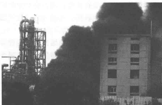
图 0-6 硝化厂爆炸

完全统计, 1949 年以来, 我国发生了十余起一次死亡百人以上的瓦斯爆炸事故, 死亡两千余人。2001~2008 年我国化工企业共发生较大及其以上级别爆炸事故 119 起, 其中, 死亡 510 人, 重伤 105 人, 轻伤 377 人。工业介质爆炸灾害已给人类社会带来的严重后果和社会效应已超过了灾害事故本身, 已经成为社会生活、经济发展的一个十分敏感的问题。在高科技越来越密集、经济规模越来越宏大的今天, 爆炸灾害的潜在可能性增加, 事故的危害程度进一步增加, 安全问题往往成为重大社会经济决策的核心问题。