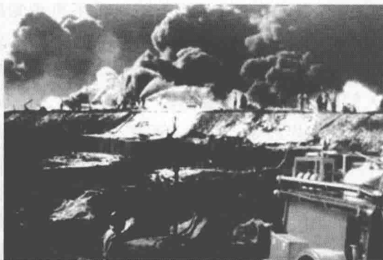
图 0-3 某油库爆炸