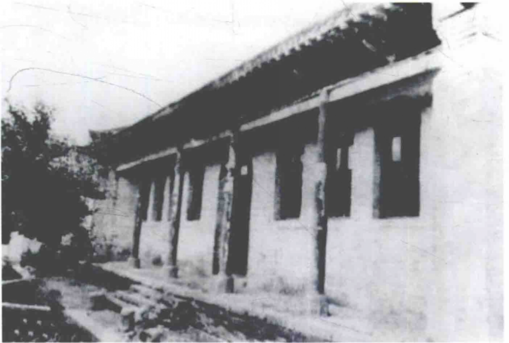
徽县天主教堂红二方面军总指挥部旧址