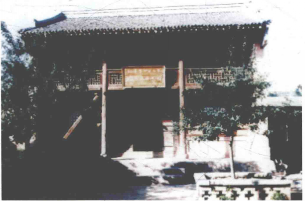
哈达铺张家大院红二方面军总指挥部旧址