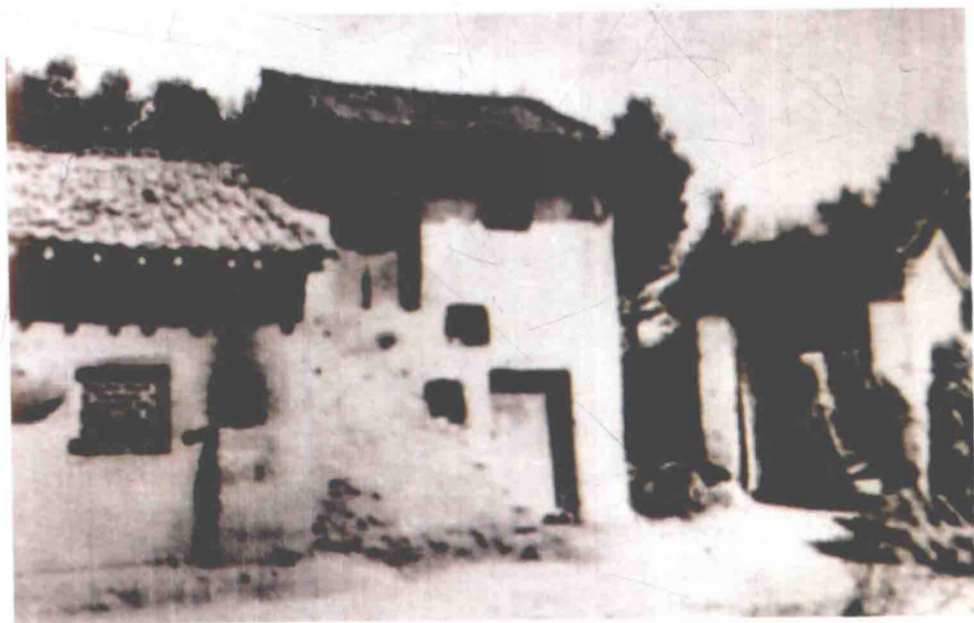
泾川县四坡村红二十五军指挥所旧址