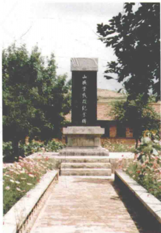
山城堡战役纪念碑