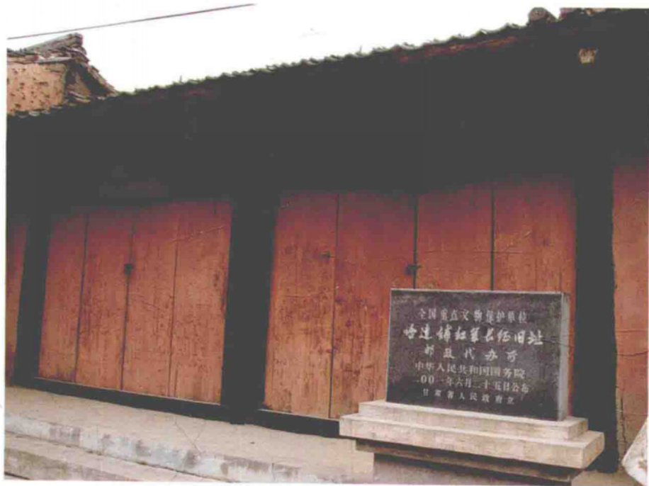
哈达铺邮政代办所旧址