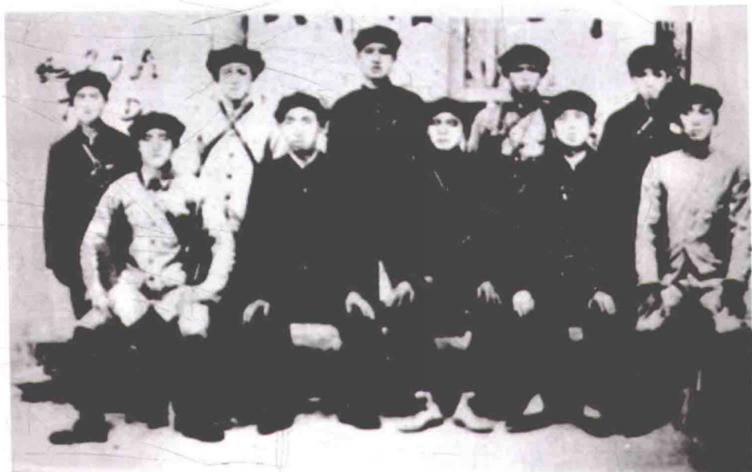
红二十五军长征途中部分干部合影(前排左一吴焕先、左二程子华、左三徐海东)