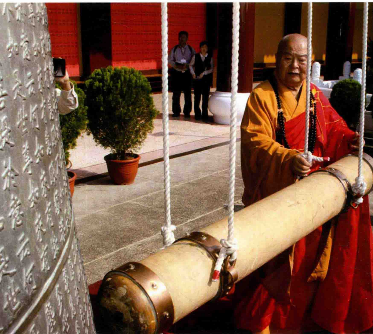
兄弟和合钟相连（2008年12月，佛光大雄宝殿前）