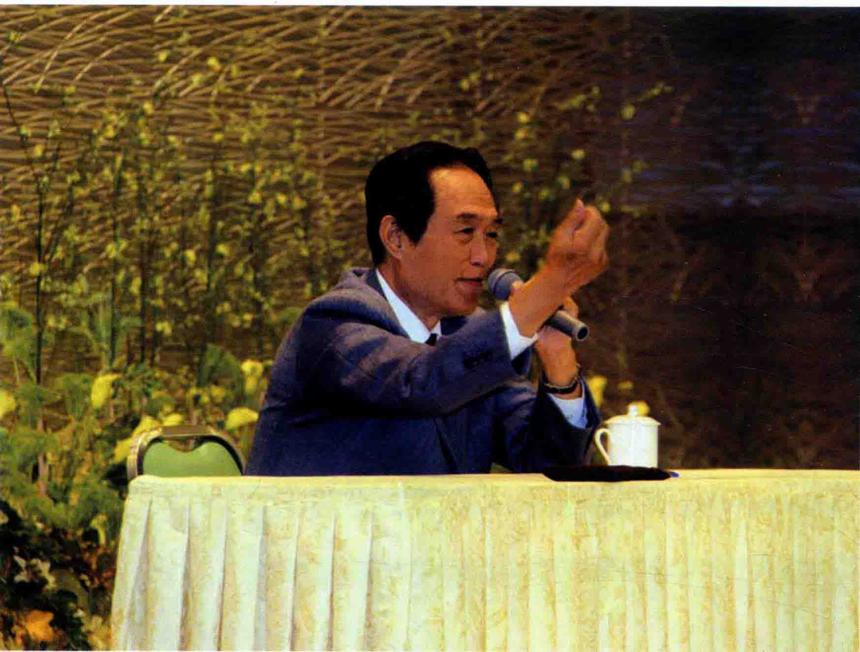
在佛光山丛林学院为师生讲清史