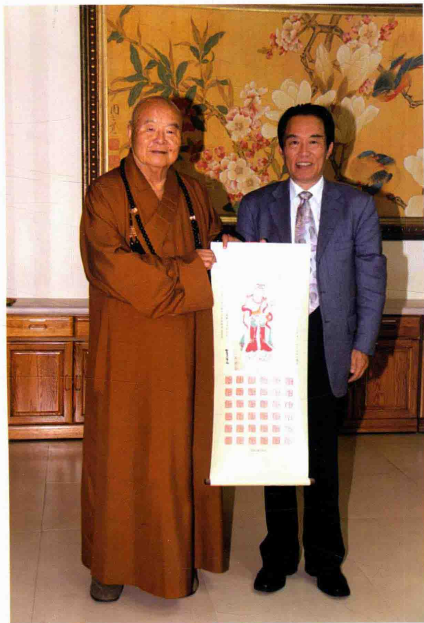
星云大师向崇年先生赠送张大千观音画 (2008年11月，佛光山传灯楼法堂)