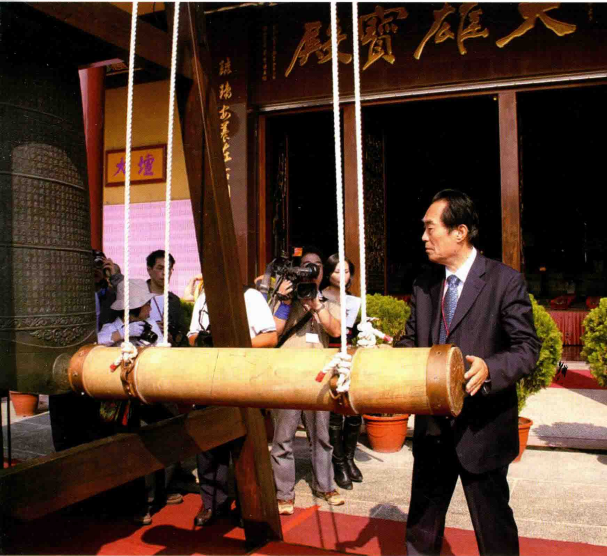
和合钟声和谐音（2008年12月，佛光大雄宝殿前）