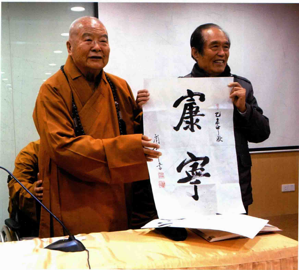
崇年先生向星云大师赠送“康宁”条幅