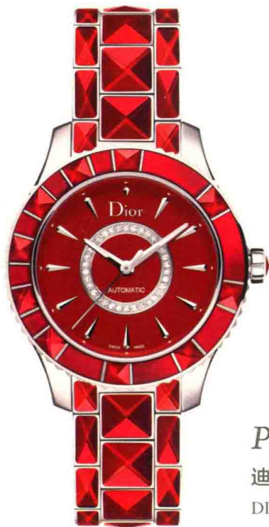
P90 迪奥 DIOR CHRISTAL腕表