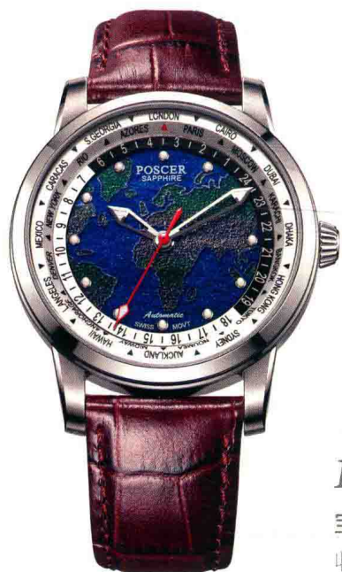
P195 宝时捷 收藏家系列世界时间腕表