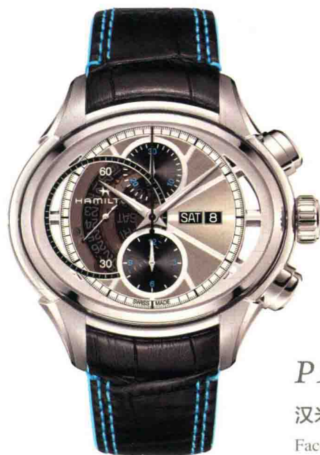
P121 汉米尔顿 Face 2 Face II