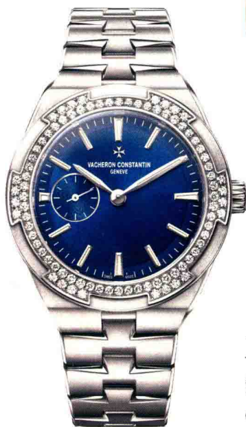
P245 江诗丹顿 Overseas纵横四海小型号

*本书标注的价格，综合了世界各地专卖店、网站提供的信息以及汇率等因素，仅供参考。