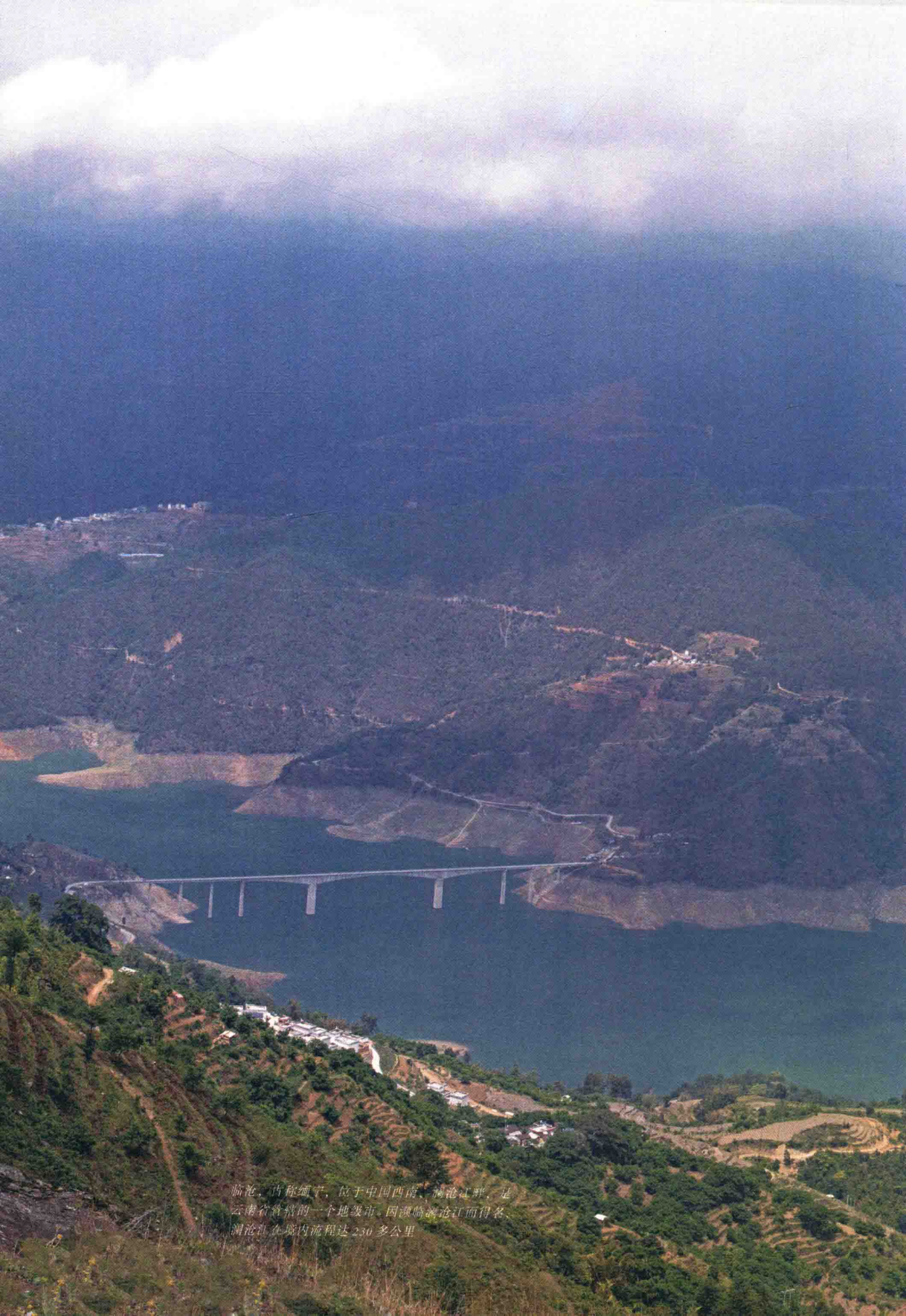
临沧，古称缅平，位于中国西南，澜沧江畔，是云南省管辖的一个地级市。因跟临澜沧江而得名。澜沧江在境内流程达230多公里。