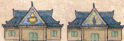
现代化的少数民族民居