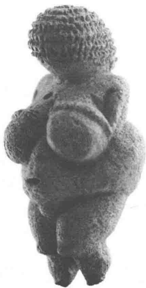
图2.2 维伦多夫的维纳斯