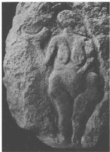
图2.1 持牛角杯的女子