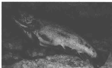
图1.2 鲟鱼（库尔贝，法国）

清代画家邹一桂的《小山画谱》对西洋画的评价是：“西洋人善勾股法，故其绘画于阴阳、远近不差锱黍。所画人物、屋树皆有日影。其所用颜色与笔与中华绝异，布影由阔而狭，以三角量之，画宫室于墙壁，令人几欲走进。学者能参用一二，亦具醒法。但笔法全无，虽工亦匠，故不入画品。”