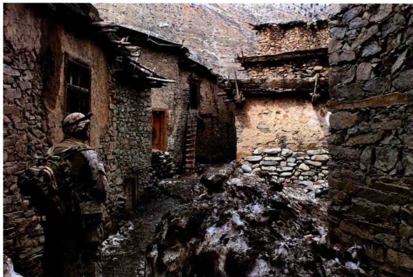
反恐战场上的作战环境

当代恐怖主义兴起于20世纪60年代末,盛行于20世纪70年代,猖獗于20世纪80年代以后。有人把这股恐怖主义狂潮称为“20世纪的政治瘟疫”,也有人把它和政治腐败、环境污染并称为21世纪人类面临的三大威胁。为了打击恐怖活动,世界各国陆续组建了许多反恐怖作战部队,不仅有军方特种部队,也有警察等执法机关的特种部队,最早的反恐作战部队在使用武器的时候存在两种现象,一种直接使用部队的军用装备,另一种使用警察部队制式武器。由于反恐部队的主力军种是特种兵,因此特战装备成了常用的反恐武器装备。