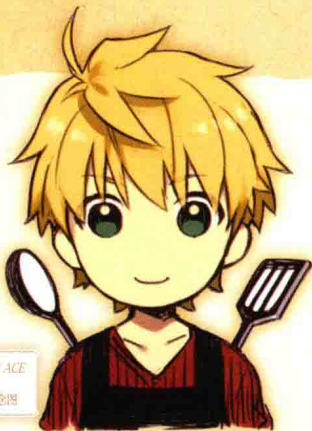
杂志TYPE-MOON ACE VOL.9 Special Comic 纪念图