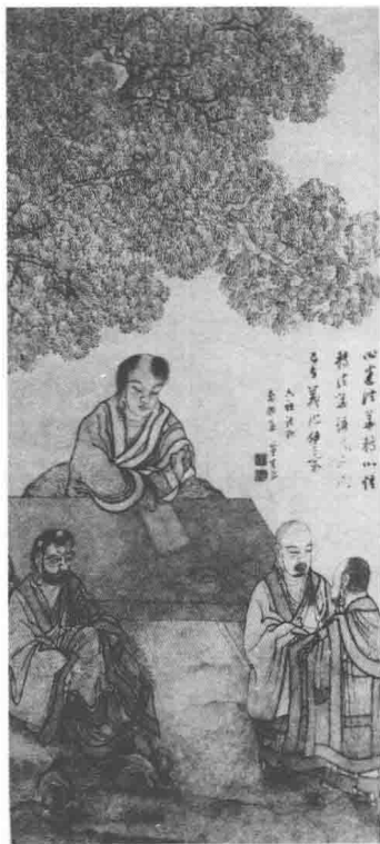
明代丁云鹏绘的六祖慧能像。画内是禅宗南宗创始人慧能在菩提树下诵经

相传，释迦牟尼佛前世是一位修行者。他诚心诚意、勇猛精进的修炼，惊动了天界，天帝为了测试他的诚心，令侍者化成一只鸽子，自己则变成一只老鹰，追逐着鸽子。修行者看到鸽子处于危险之中，挺身而出，把鸽子放在怀里保护着。老鹰捉不到鸽子，责问修行者：“我快饿死了，现在你救了他，却会害了我的命啊！”修行者说：“你说得有道理，鸽子身上的肉有多重，你就在我身上叼多少肉吃吧！”天帝使用法力让放在秤上的修行者的肉总是比鸽子肉轻。但修行者还是忍痛割下，直到割光了全身的肉，两边的重量仍是无法相等。修行者只好舍身爬上秤以求均等。天帝为修行者的精神所感动，变回原形，问：“当你发现自己的肉已经割尽，重量还是不平等时，是否会产生怨恨之心呢？”修行者答道：“行菩萨道者应有难行难修，人溺己溺的精神，为了普度众生的疾苦，即使牺牲生命也在所不惜，怎么会有怨恨之心呢？”天帝被他的慈悲心和无畏的精神所震撼，又使用法力让他恢复了原身。