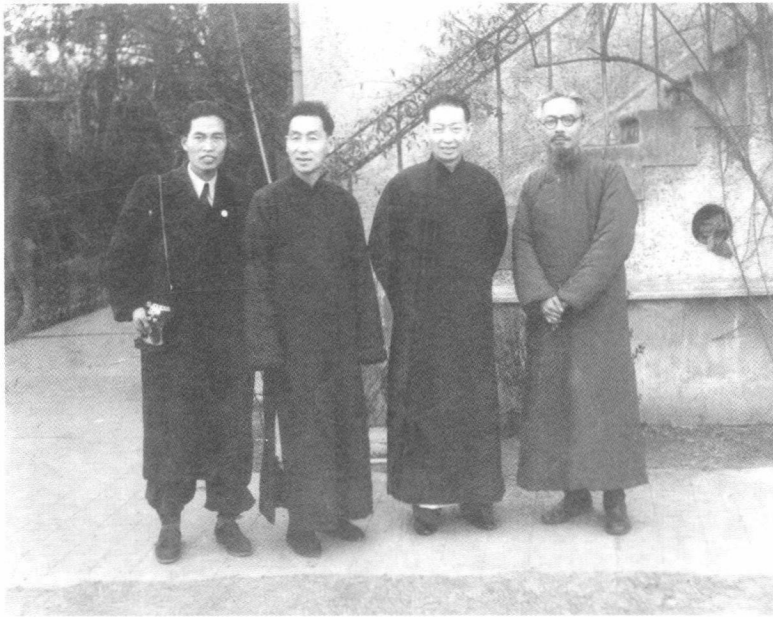
丰子恺（右一）在上海梅寓与梅兰芳（右二）、 郎静山（右三）等合影（摄于1947年）