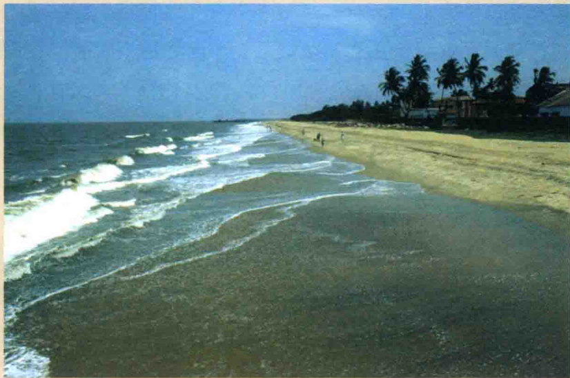
↑ 印度卡利卡特（古里）

古里对郑和船队的意义不仅于此。最后一次也就是第七次航行中，船队航行到古里附近时郑和因劳累过度一病不起。宣德八年（1433年）四月初，郑和在古里逝世。郑和的船队在这里永远地失去了他们英明的领导者。