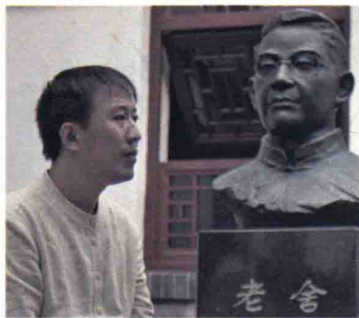
魏新，文化学者，全国青联常委， 央视《百家讲坛》主讲人。