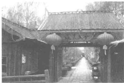
图 1-2 农家乐旅游

业功能的拓展，农业不仅具有食品保障功能，而且具有原料供给、就业增收、生态保护、观光休闲、文化传承等功能。农业的环境与资源特质，为休闲农业活动的开展提供了最适当的来源。这里所说的农业资源，是指所有能够投入休闲农业活动的农业生产、农民生活、农村生态等要素的“三生”资源。