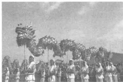
图 1-1 民俗旅游