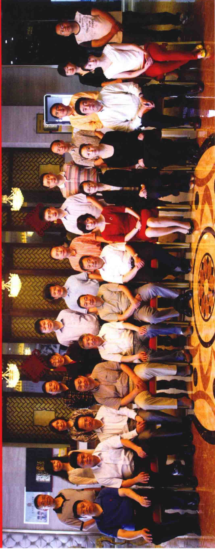
《中华战创伤学》第二次主编会议参会人员合影