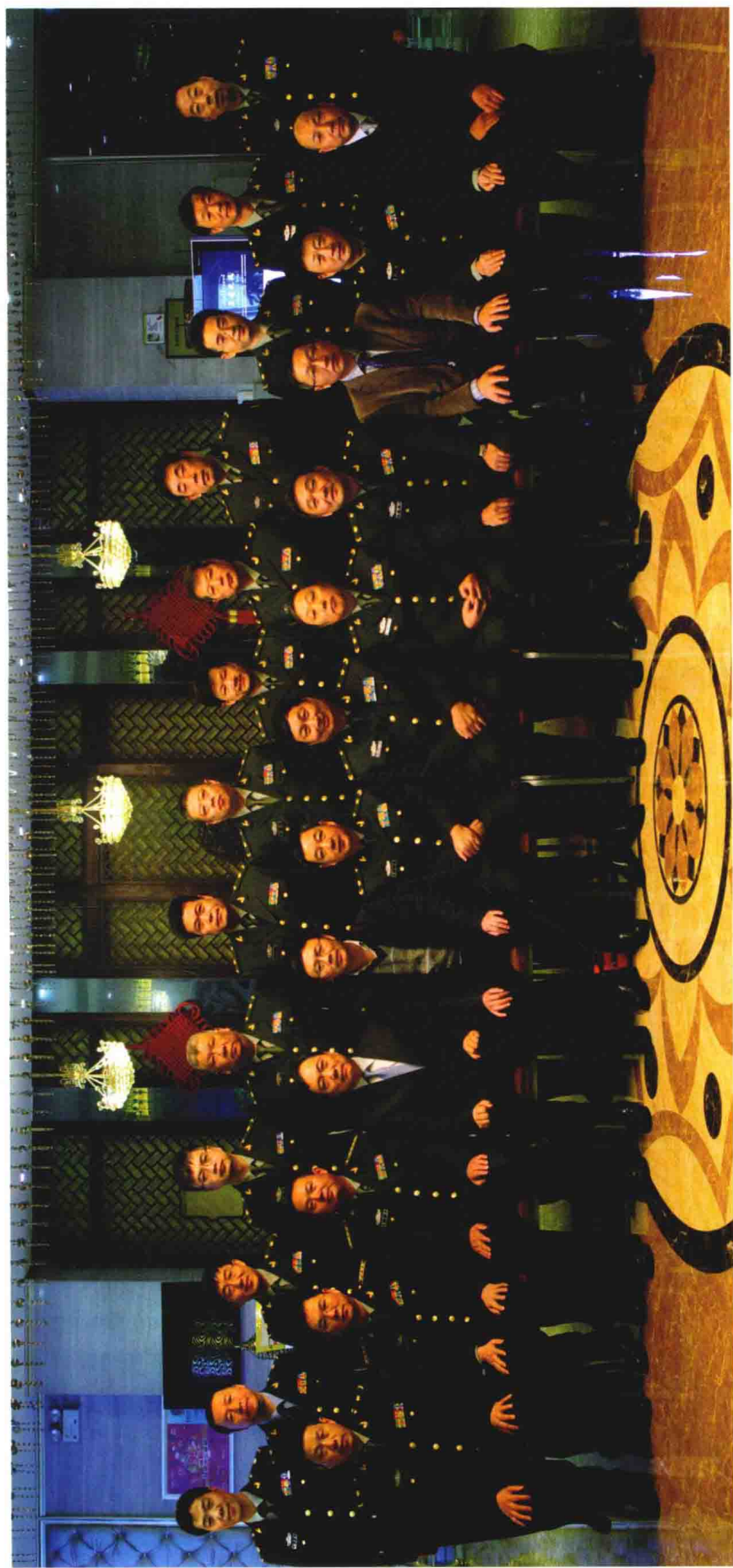
《中华战创伤学》总主编付小兵院士与分卷主编合影