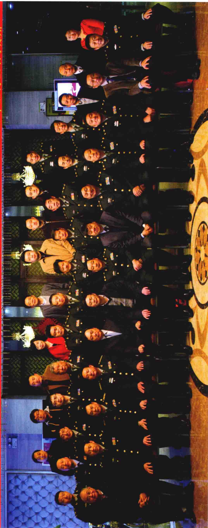
《中华战创伤学》第三次主编会议参会人员合影