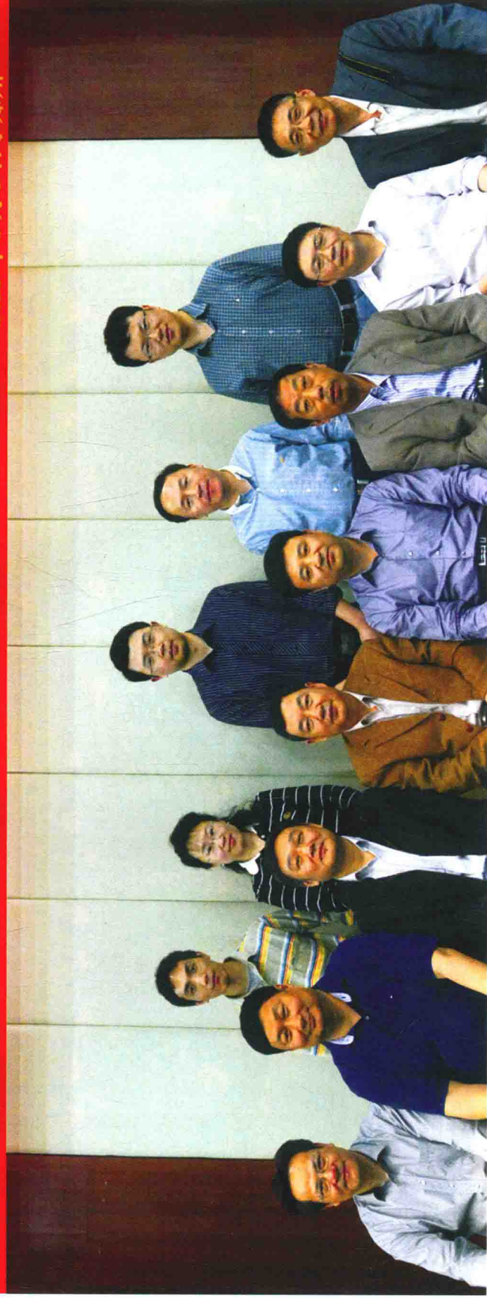
《中华战创伤学》第一次主编会议参会人员合影