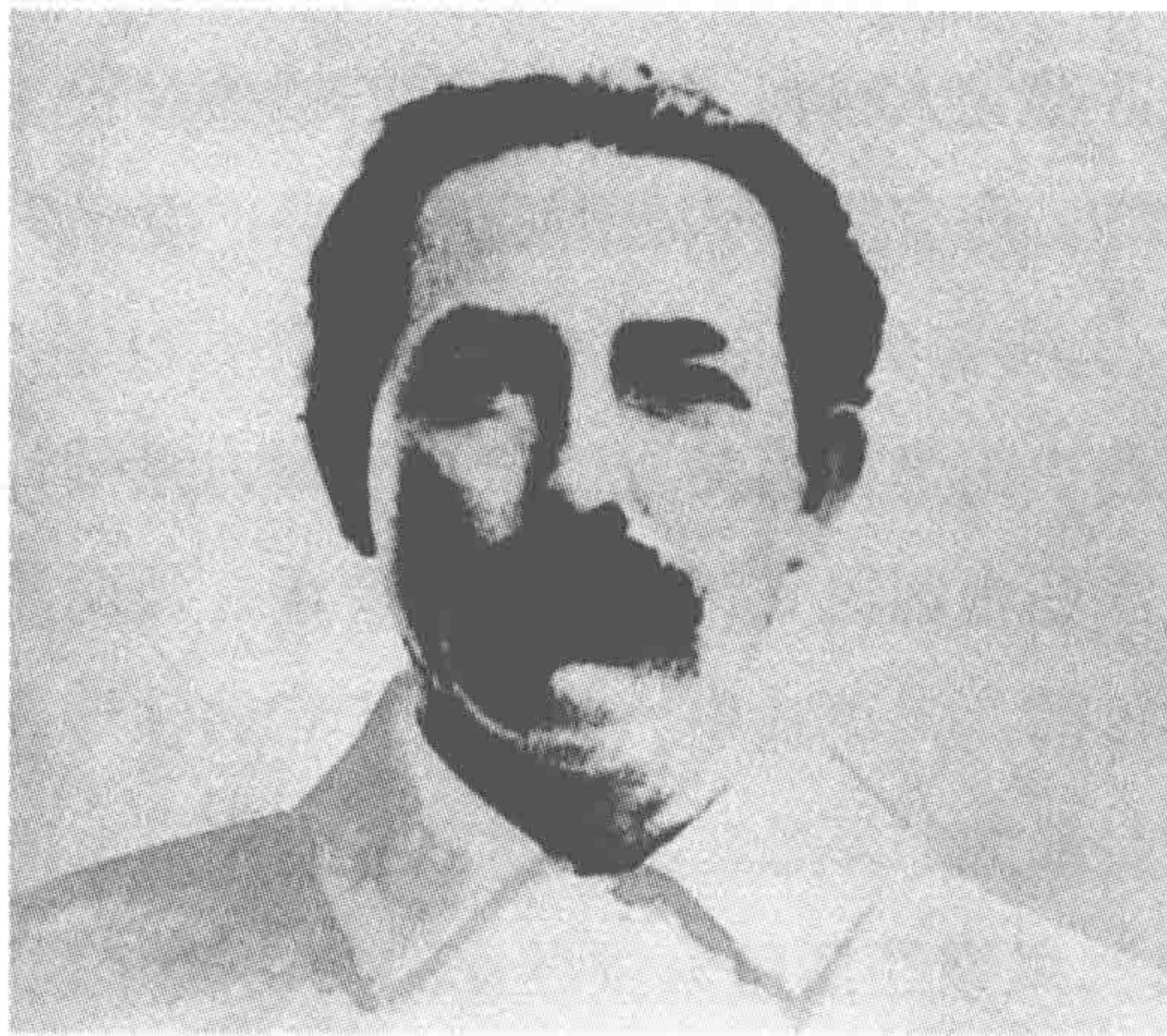
图 1—1 鲍罗廷

共产国际代表鲍罗廷不顾中国共产党人的反对意见，同意了孙中山的提议，设立国际联络委员会来监督共产党的活动。这种举动引起了共产党人的极大不满，陈独秀在给共产国际的信中就愤怒地指出：“中国无产阶级、中国国民革命应当采取联合行动的策略，而共产国际代表同