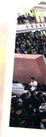
2016年，第五届“泛海扬帆”杯重庆大学生创业大赛总决赛现场，评委们正在对展示的企业项目进行打分