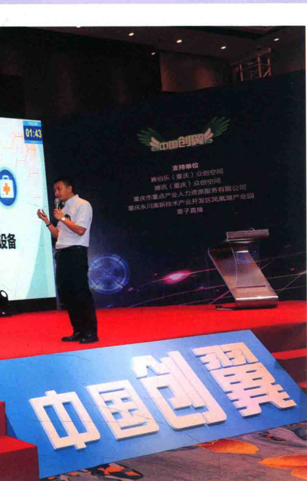
2016年,第二届“中国创翼”青年创新创业大赛高端装备制造业全国总决赛现场,企业组偏头痛智能穿戴治疗设备项目选手正在回答评委问题