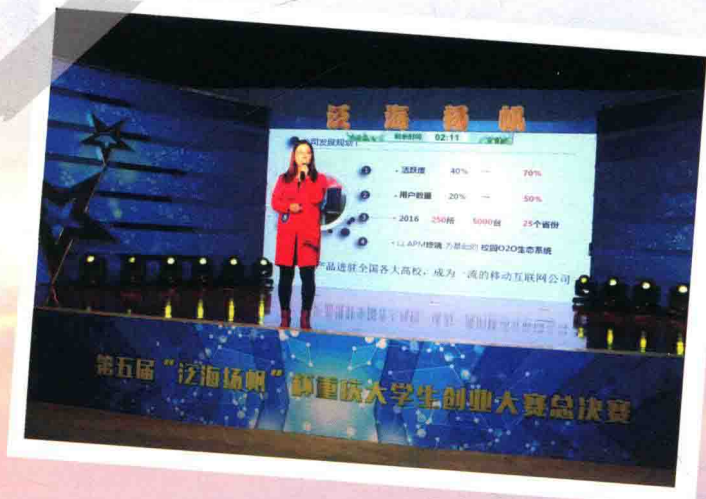
2016年,第五届“泛海扬帆”杯重庆大学生创业大赛总决赛现场,创业者对自己的创业项目进行展示