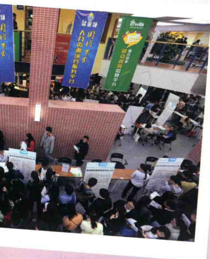
2017年年初,高校毕业生涌入重庆市大学生就业创业公共服务中心参加招聘会求职