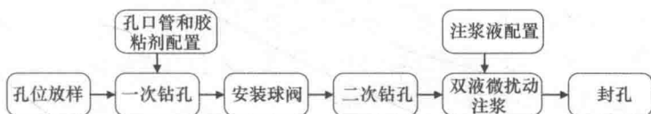
图 4.1.3 隧道内部地基注浆施工程序图

4.1.3 隧道地基注浆施工应根据地层条件和周边环境条件编制专项施工方案。隧道内部地基注浆施工程序可按图 4.1.3 进行。