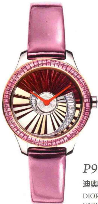
P99 迪奥 DIOR VIII GRAND BAL PIÈCE UNIQUE ENVOL N° 2