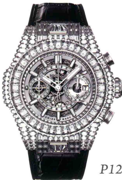
P127 宇舶 Big Bang Unico “10周年”高级珠宝腕表