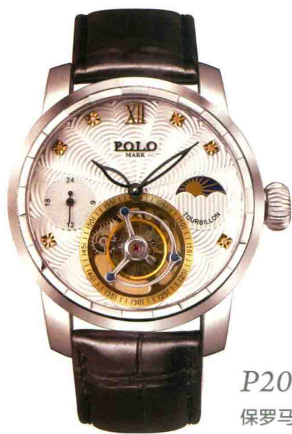
P203 保罗马克 日月相陀飞轮真钻腕表