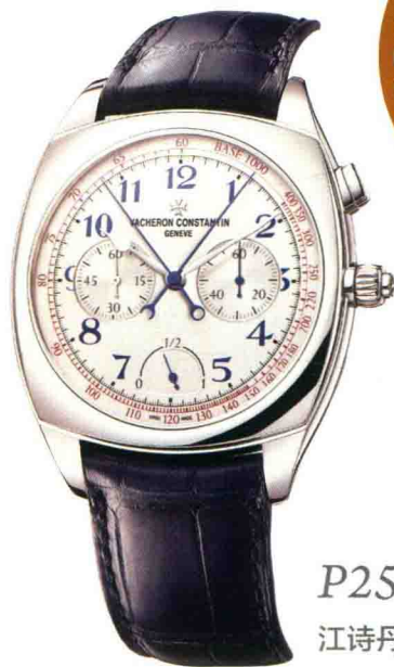
P250 江诗丹顿 Harmony系列超薄高级复杂计时

*本书标注的价格，综合了世界各地专卖店、网站提供的信息以及汇率等因素，仅供参考。