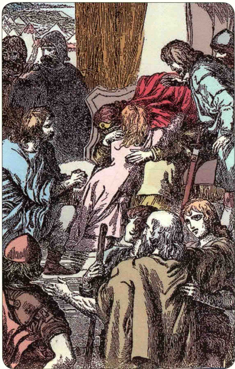
辛白林流下了幸福的泪水