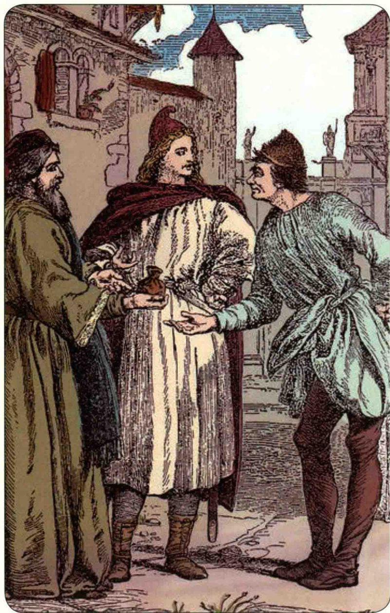
小安提福勒斯把他的钱袋给了小德洛米奥