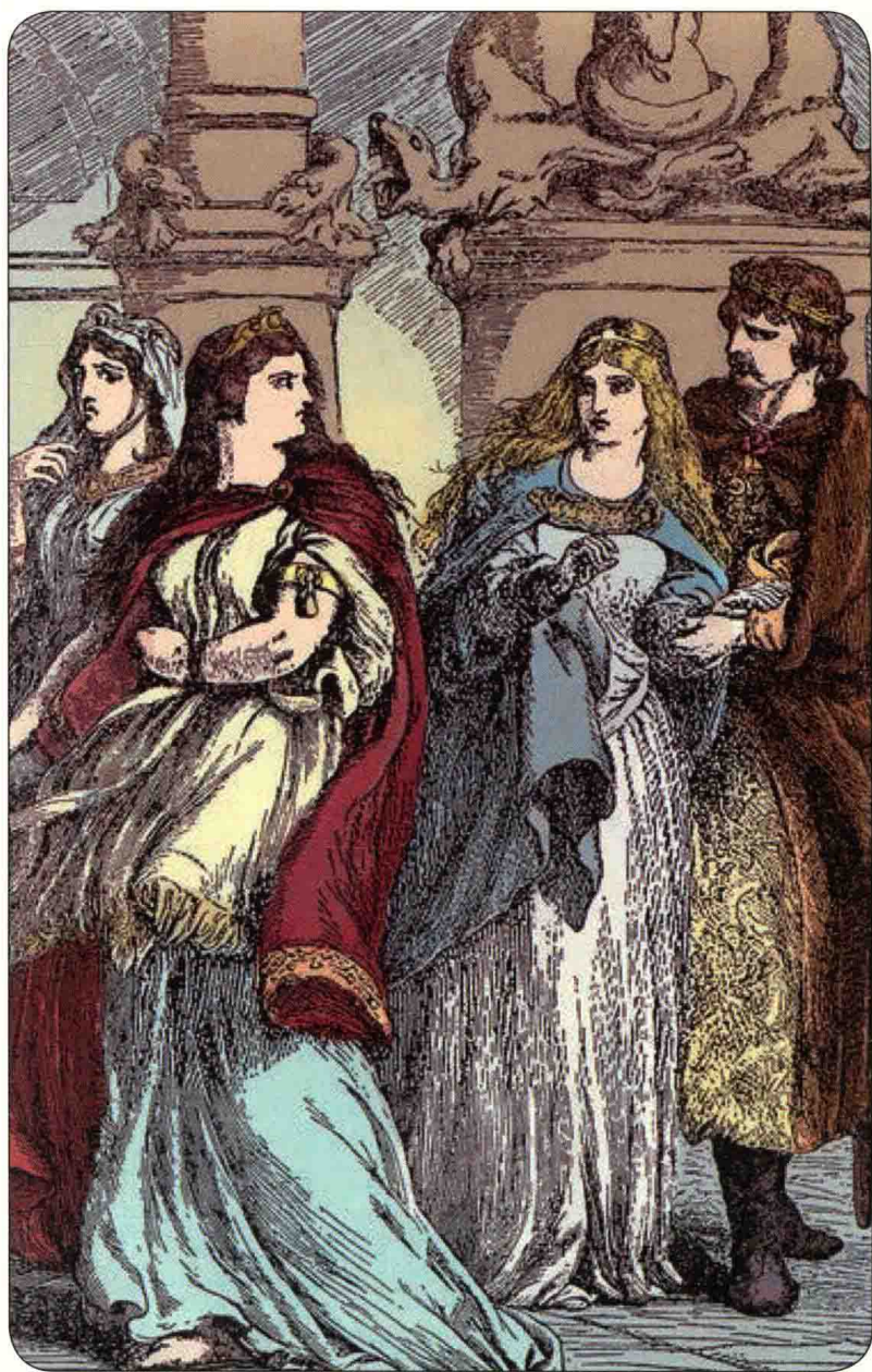
考迪莉娅跟她的姐姐们告别