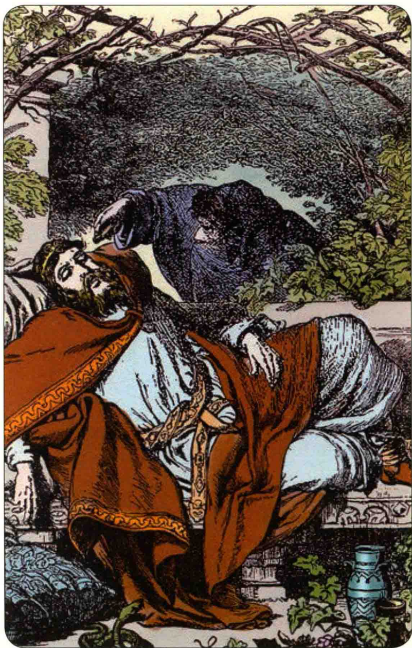
老哈姆莱特和他的弟弟