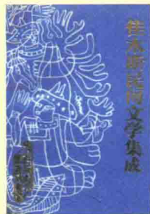
《佳木斯民间文学集成》封面