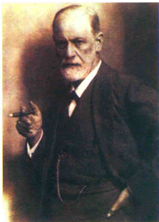
精神分析学的鼻祖 弗洛伊德 摄影

诸位可能从平日的读书或者看新闻中或多或少知道一些有关精神分析方面的知识，但是我并不清楚你们对此了解多少。鉴于我的题目是“精神分析引论”，顾名思义，所以我只好假设你们对于这一领域一无所知，需要我从头讲给你们听。