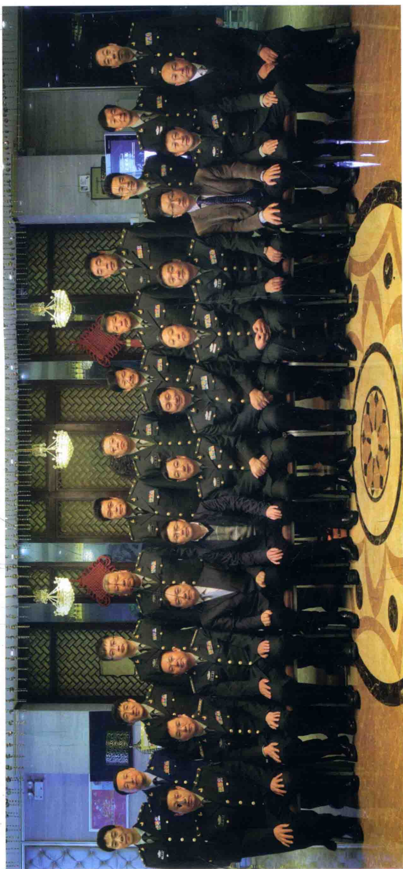
《中华战创伤学》总主编付小兵院士与分卷主编合影