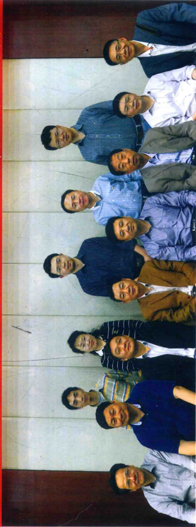
《中华战创伤学》第一次主编会议参会人员合影