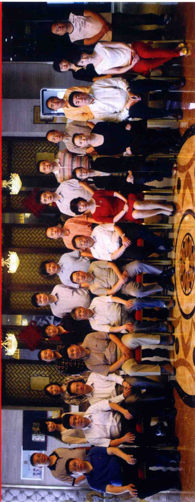
《中华战创伤学》第二次主编会议参会人员合影