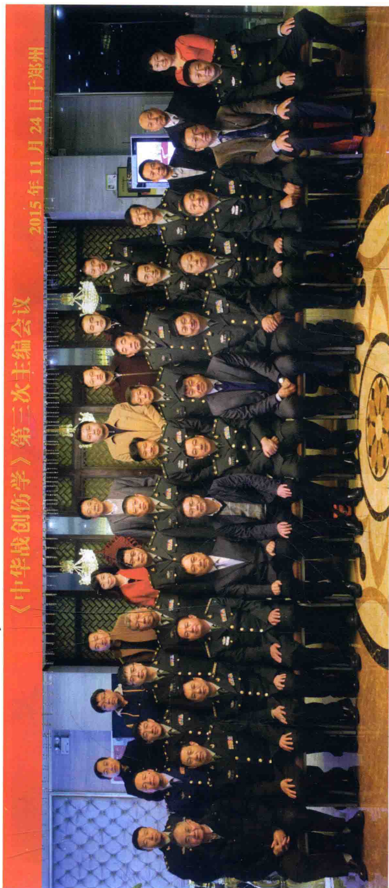
《中华战创伤学》第三次主编会议参会人员合影