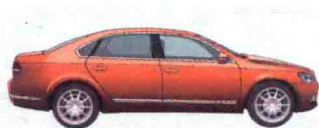
错误行驶或操作的车辆