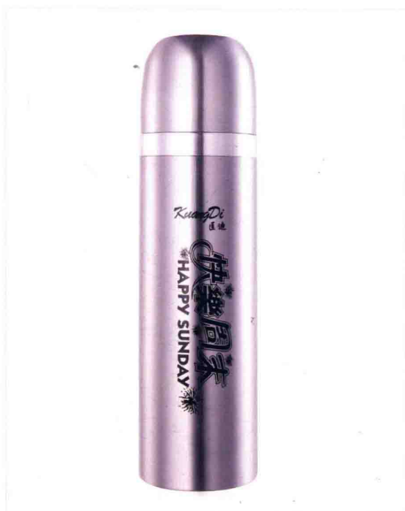
• 不锈钢水杯的白底拍摄 /114页