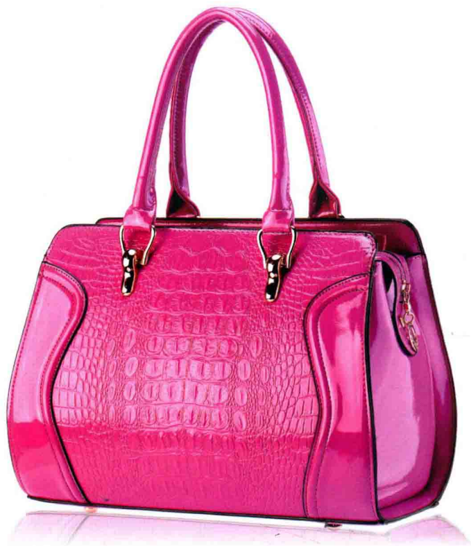
●●●● 漆皮女包的白底拍摄 /109页 ●●●●