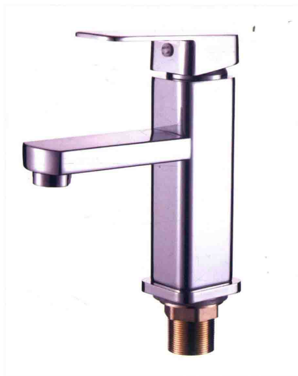
• 水龙头的白底拍摄 /145页