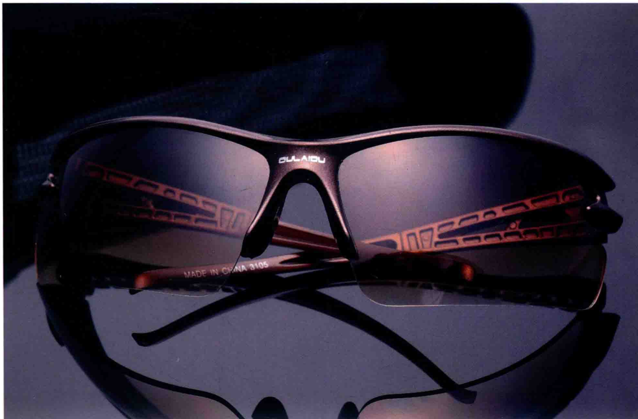
..... 男士眼镜的场景拍摄 /120页 .....