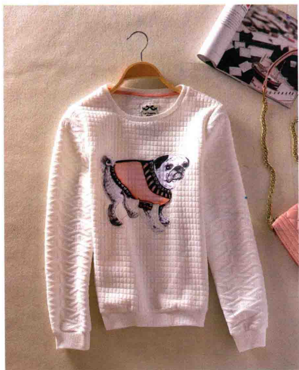
● 平铺女装的场景拍摄 /75页