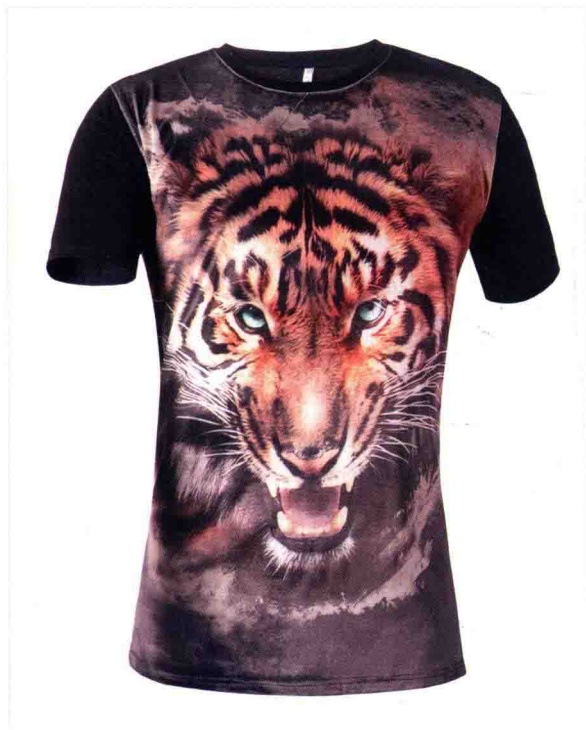
• 3D立体男装的白底拍摄 /83页