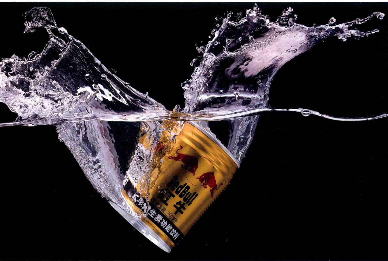
••••• 红牛广告拍摄 /178页 •••••