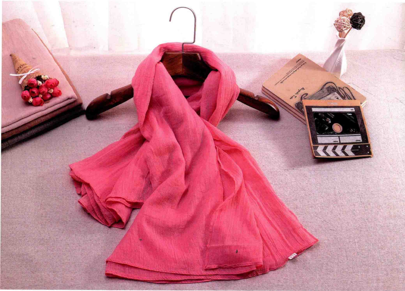
..... 时尚围巾的场景拍摄 /98页 .....