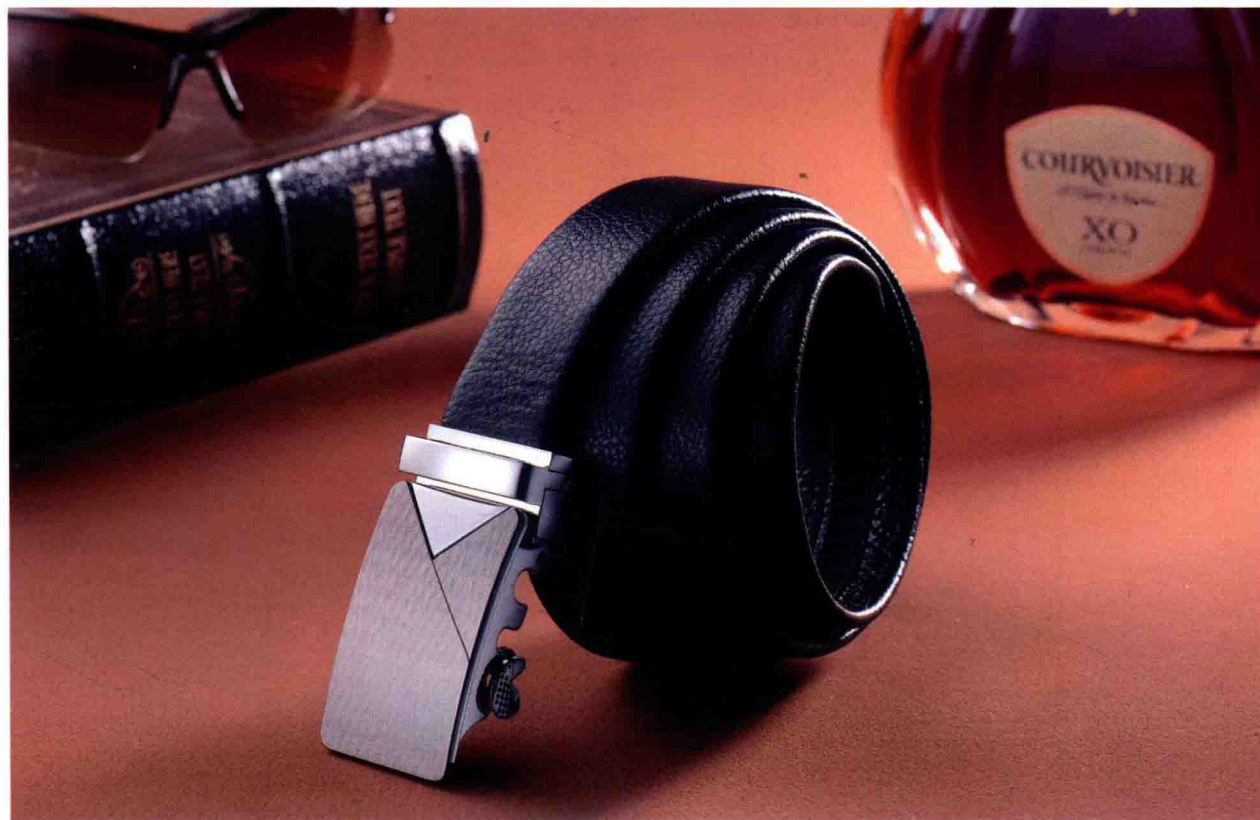
..... 男士皮带的场景拍摄 /124页 .....