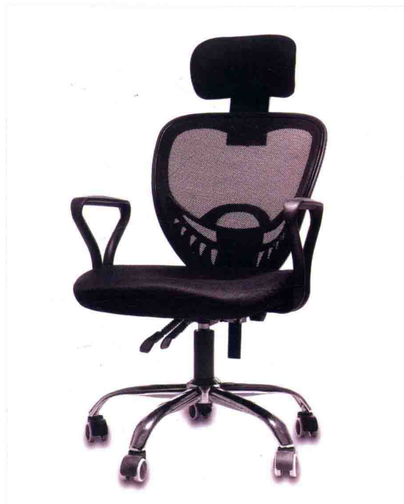
• 旋转办公椅的白底拍摄 /102页