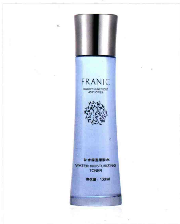
• 柔肤水的白底拍摄 /153页