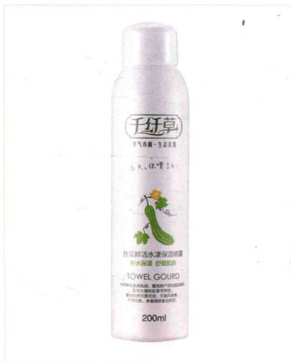
• 亚光喷雾的白底拍摄 /129页