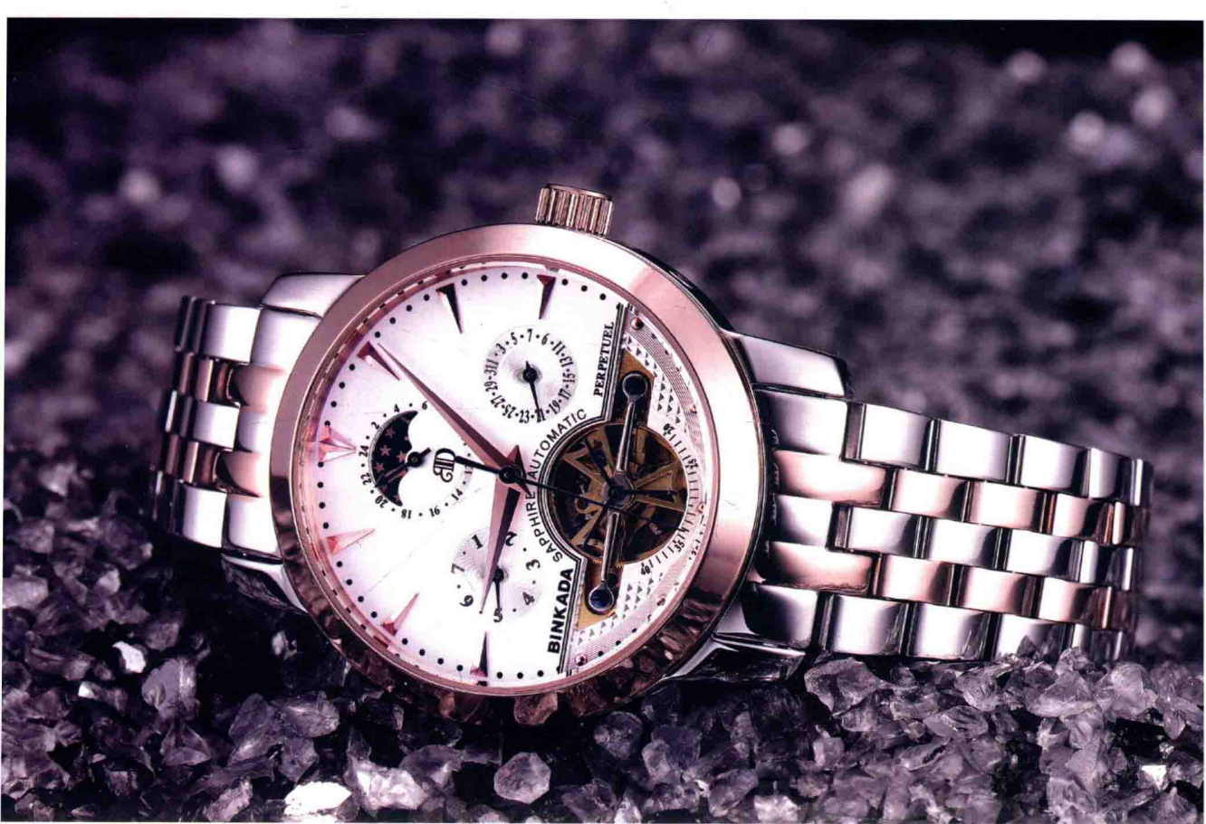
••••• 男士手表的场景拍摄 /137页 •••••