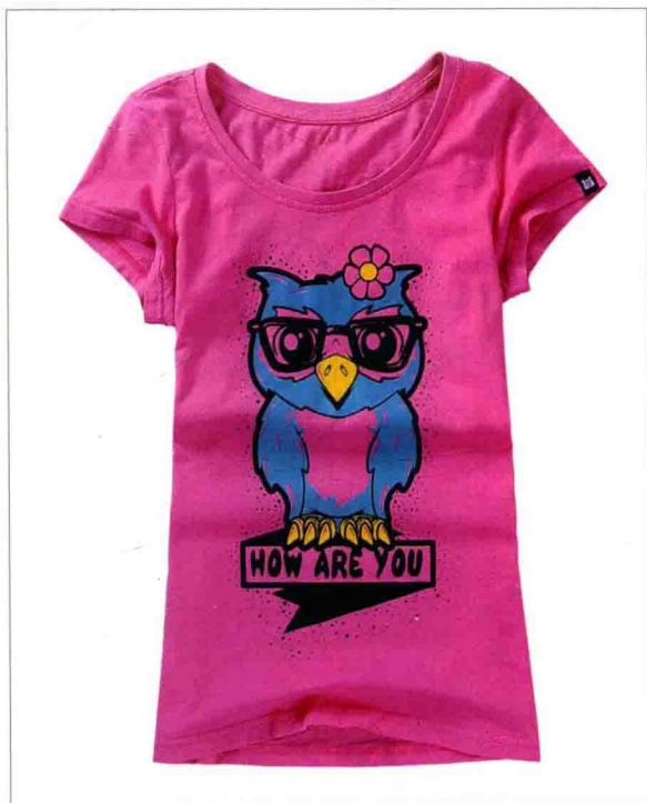
● 平铺女装的白底拍摄 /69页