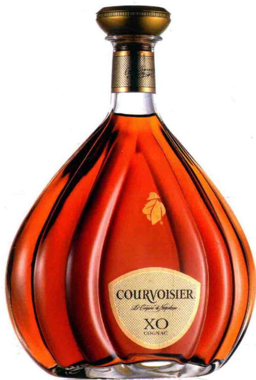
••••• XO洋酒的白底拍摄 /165页 •••••