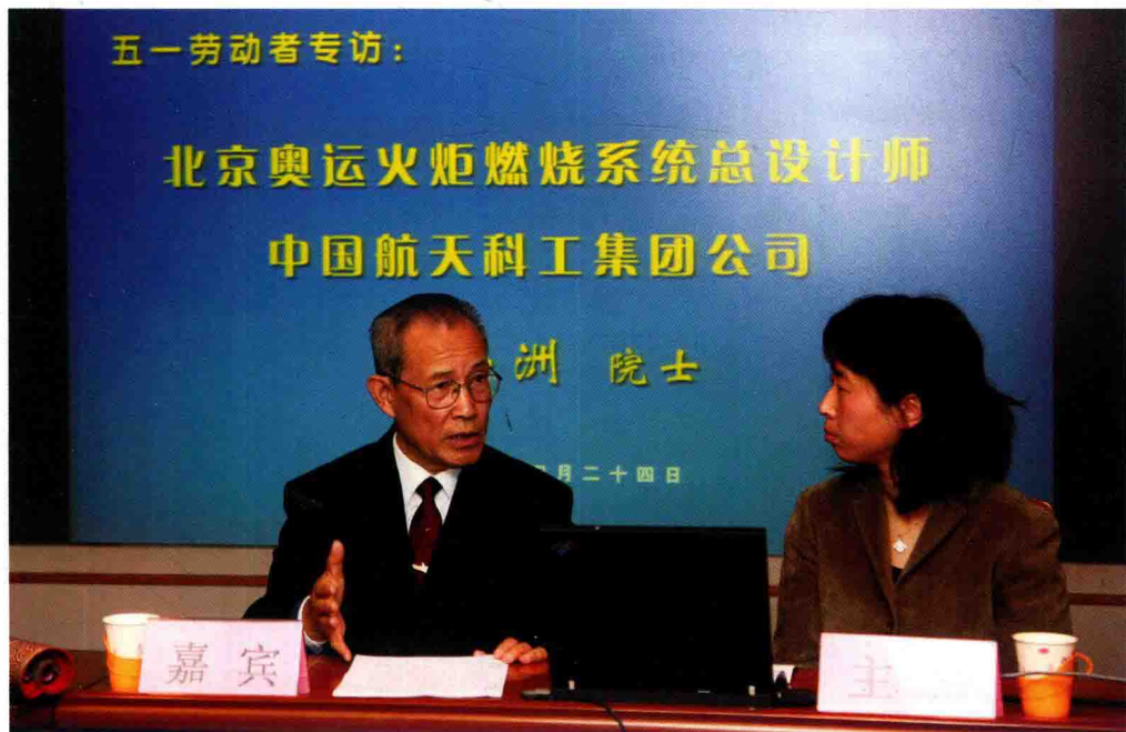
上图 / 刘兴洲在奥运火炬赴藏出征仪式上讲解火炬技术