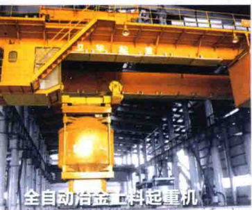
全自动冶金上料起重机