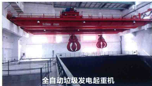
全自动垃圾发电起重机