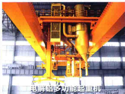
电解铝多功能起重机