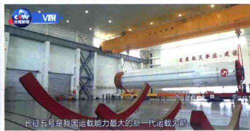
长征五号是我国运载能力最大的新一代运载火箭