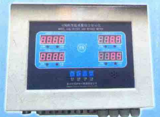
GDQ型高度起重重量综合仪