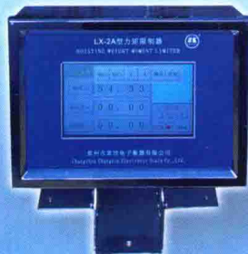
LX型起重力矩限制器