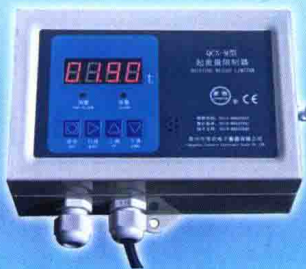
QCX-M型起重重量限制器