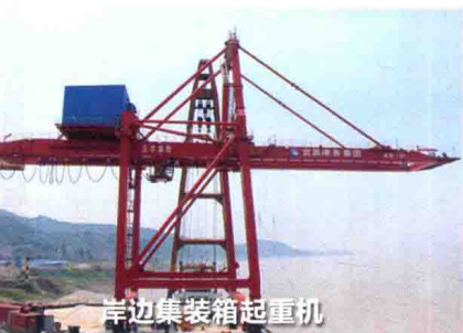
岸边集装箱起重机