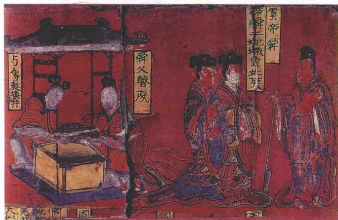
北魏屏风漆画列女古贤图“有虞二妃”