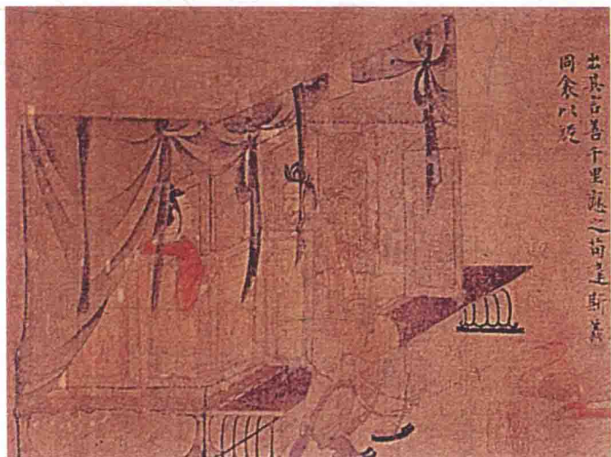
东晋女史箴图“同衾以疑”