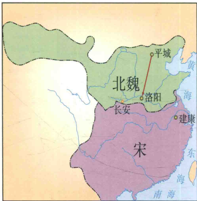
南北朝初期形势图