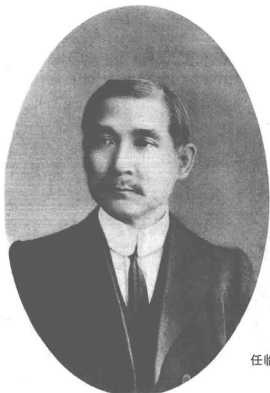
任临时大总统时的孙中山