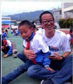
4月20日雅安芦山新东方小学，俞敏洪老师和小学生互动