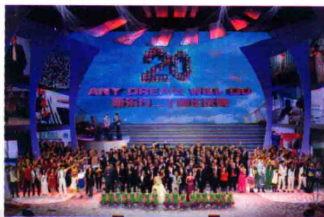
11月16日，新东方20周年庆典在人民大会堂举办