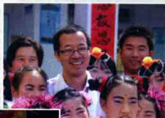
舟曲希望小学落成典礼，俞敏洪老师与孩子们