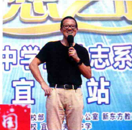
4月11日梦想之旅宜昌站，俞敏洪老师在夷陵中学演讲