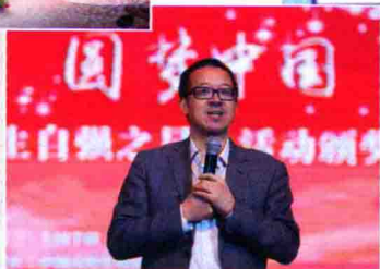
3月，俞敏洪老师在自强之星颁奖典礼上演讲