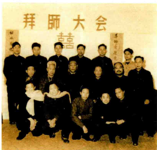
1962 年中医研究院针灸研究所老中医带徒拜师大会