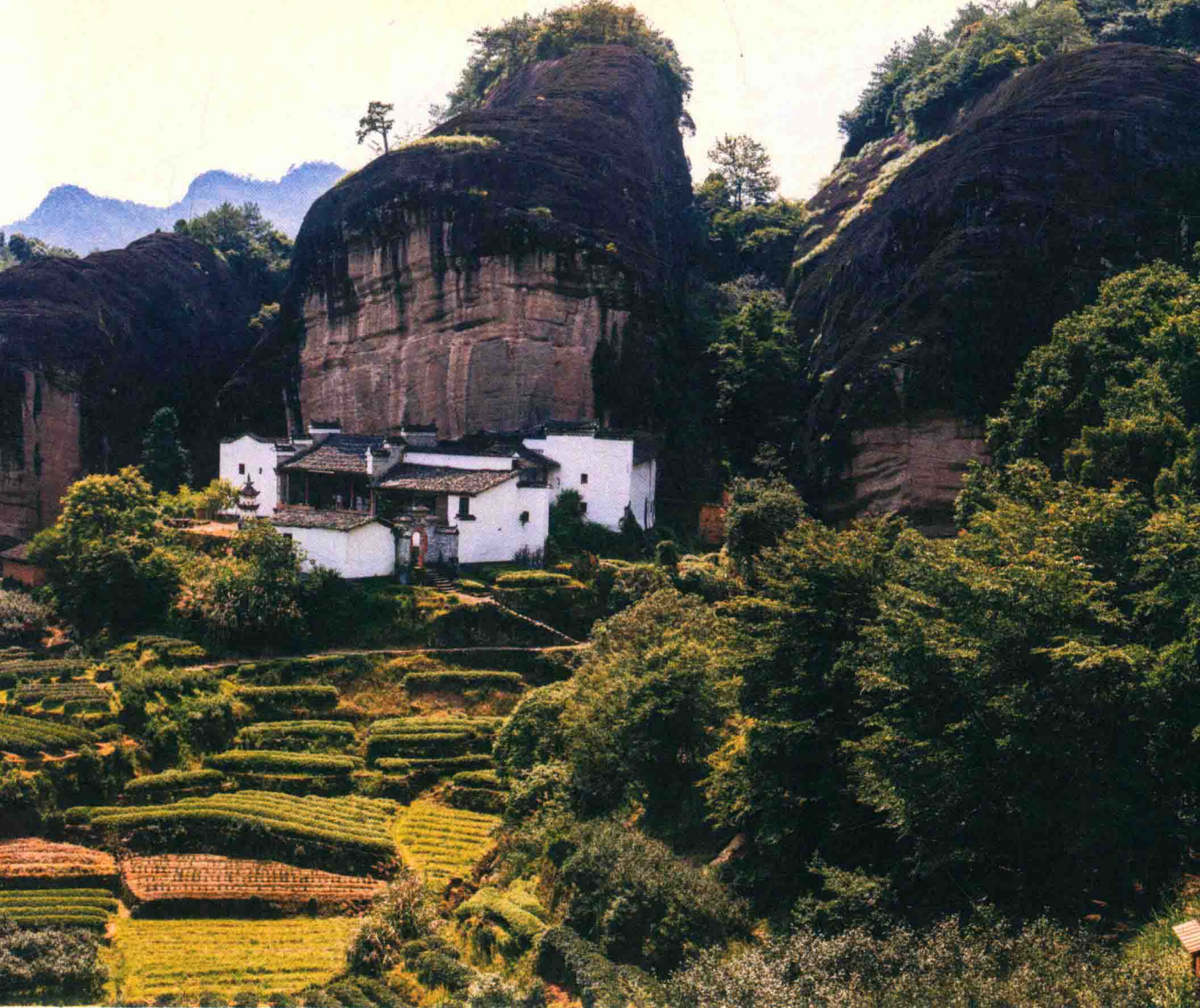
武夷山三十六名峰之一马头岩，岩下道观名为磊石道观。马头岩多种肉桂，近年来也备受市场关注，常与牛栏坑肉桂一并被茶客提及讨论

江西、闽南、潮汕等地。到了当代，武夷山对周边地区的吸引力不减反增。截至2015年，武夷山全市（包括景区外）的种茶面积为14.8万亩，共有96个行政村（占行政村总数的83.48%）种植茶叶，涉茶人口达到了8万。为了保护生态，2012年市政府全面禁止新开茶园。正岩所在地武夷山风景区内作为非遗保护项目，更是一土一木都不能随便动。