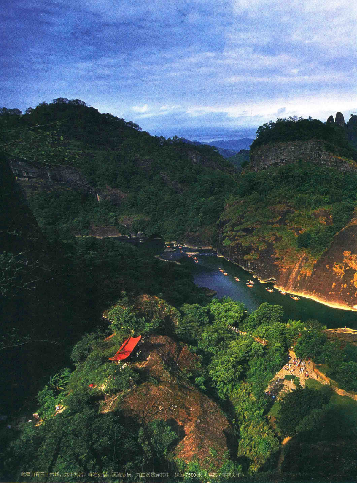
武夷山有三十六峰，九十九岩。峰岩交错，溪流纵横，九曲溪贯穿其中，蜿蜒7500米。