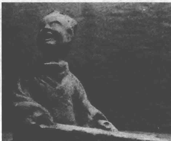
汉代 弦歌（抚琴而歌）俑

古琴传说是由伏羲、神农、尧、舜等中华民族的先祖圣王所创制，并以之教化天下。如东汉蔡邕《琴操》：“昔伏羲氏之作琴，所以修身理性，返天真也。”马融《长笛赋》：“昔庖羲作琴；神农造瑟。”（李善注：“庖羲即伏羲也”）甲骨文及金文中的“乐”字是“上丝下木”，丝张于木上的象形，被甲骨文研究者视为琴瑟一类张弦乐器的早期形象。根据《史记》记载，古琴的创制不晚于尧舜时期，距今已有着至少 4000 年的历史。《史记·五帝本纪》：“尧乃赐舜絺衣，与琴，为筑仓廩，予牛羊。”《礼记·乐记》：“昔者舜作五弦之琴，以歌《南风》。”《孔