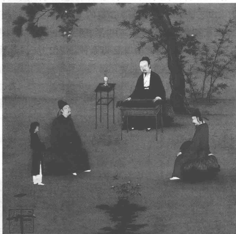
宋徽宗赵佶《听琴图》局部（故宫博物院藏）

师文等，师襄子（孔子的古琴老师）等人。自西汉起，历代均设有琴待诏的官职。唐代著名职业琴家薛易简所著《琴诀》对后世的琴学规范影响很大，而以琴为生的董庭兰更是在当时的文人阶层中美名远扬，以至于唐代很多著名诗人都曾为他写下诗篇，其中“莫愁前路无知已，天下谁人不识君”更是成为了千古绝句（高适《别董大》）。此外，还有很多历史文化名人均通晓古琴或擅长抚琴，如尧、舜、周文王、周武王、伯牙、孔子、西施、赵飞燕、司马相如、卓文君、蔡邕、蔡文姬、曹植、嵇康、阮籍、李世民、李白、白居易、王维、欧阳修、苏轼、宋太祖赵匡胤、宋徽宗赵佶、李清照、赵孟頫、朱熹、文天祥，等等。其中，蔡邕、嵇康、苏轼、朱熹、冷谦、赵孟頫等人的古琴论著现今还留存于世。李白、白居易、韩愈、王维、苏轼、李清照等著名诗人也写有许多与古琴相关的诗作。古琴艺术发展至唐宋时，已形成了气象万千、颇具文人意趣的古琴美学。