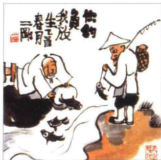
▲ 丰子恺 护生画集

近代画师们受外来绘画风格的影响，同时结合中国画的神韵，发展出了一种更加唯美、精致的绘画类型，这些画以古代服侍场景为蓝本，吸收漫画夸张的表现形式，最终形成了现在的古风插画，因此古风插画是中西合璧的产物。与此同时，随着古风歌曲、古风影视剧的风靡，“古风”这种形式也被推广开来，为更多人所熟知。