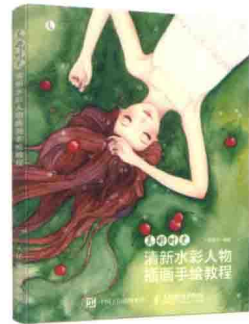
《美好时光——清新水彩人物插画手绘教程》 ISBN 978-7-115-43679-5