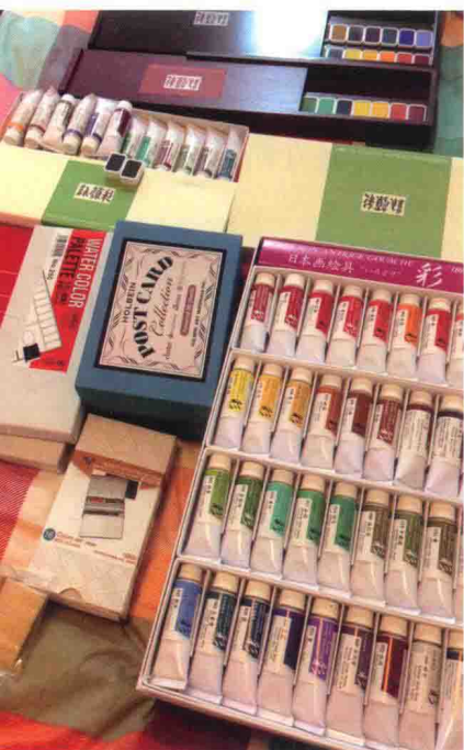
◀ 现代工艺制造的多种颜料

画师们依照自己的创作习惯运用不同的媒介，就诞生出了多种画风。水彩的灵动、水粉的厚重、墨汁的复古，都对画风形成有着至关重要的作用。本书将主要使用水彩，同时为大家展示这种神奇多变的颜料如何被运用在古风插画中，当然媒介毕竟只是媒介，创作的核心，还是画师的想法和创意。