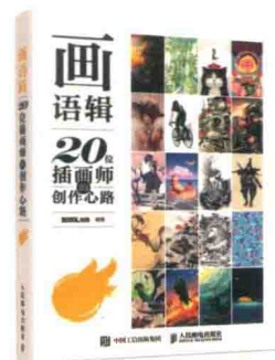
《画语辑——20位插画师的创作心路》 ISBN 978-7-115-43554-5