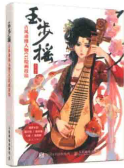
《玉步摇——古风动漫人物CG绘画技法》 ISBN 978-7-115-42906-3