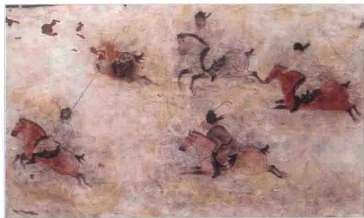
▲ 唐壁画 马球图