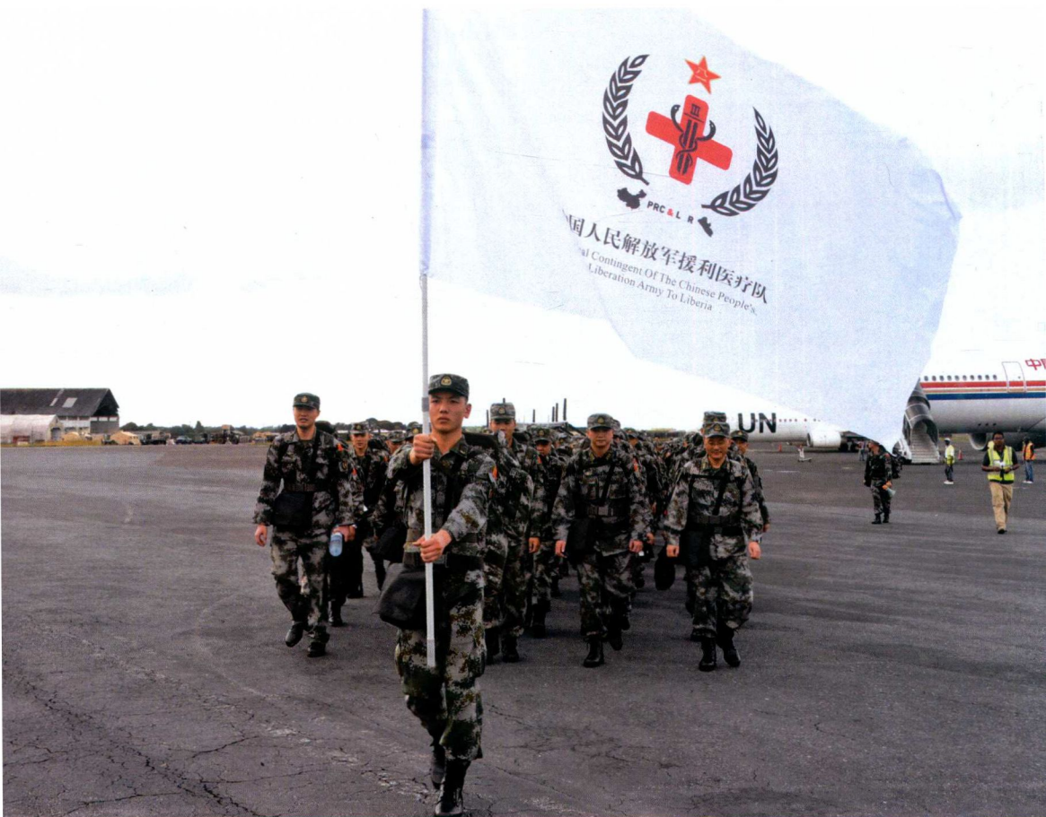
2014年11月15日，中国人民解放军援利医疗队大部队抵达利比里亚首都蒙罗维亚，开赴抗疫第一线。