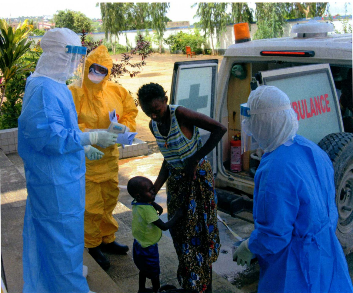
2014年10月11日，中国人民解放军援塞医疗队收治埃博拉疑似病人。