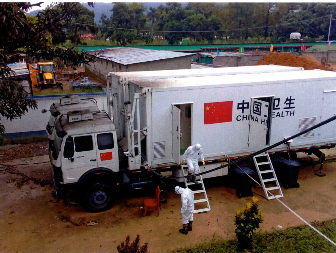
2014年11月23日，中国援塞移动实验室检测队队员完成检测工作后走出移动实验室。