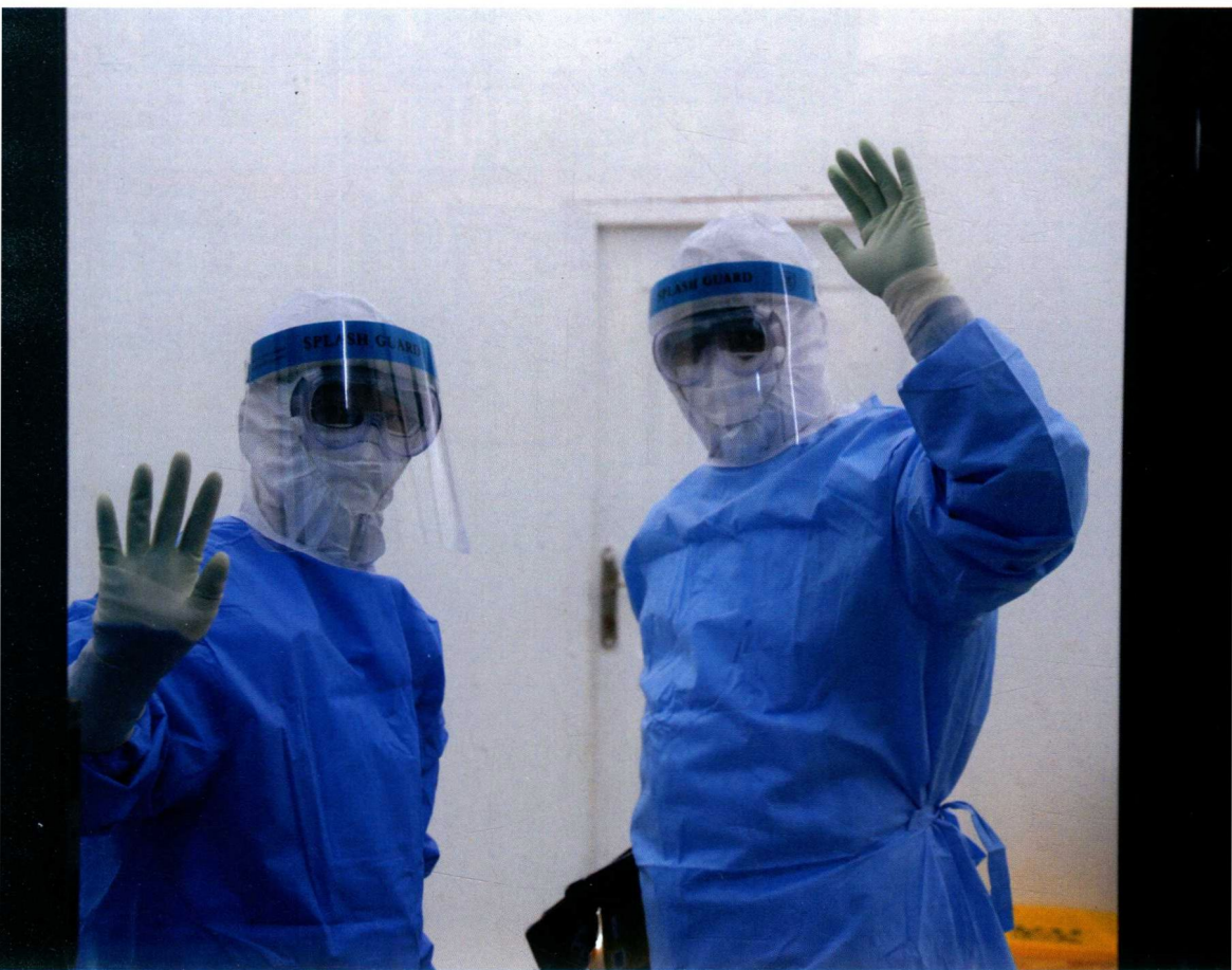
放心吧，战友！2014年10月15日，中国人民解放军援塞医疗队员进入病区前，隔着缓冲区的玻璃门框与门外队友挥手。