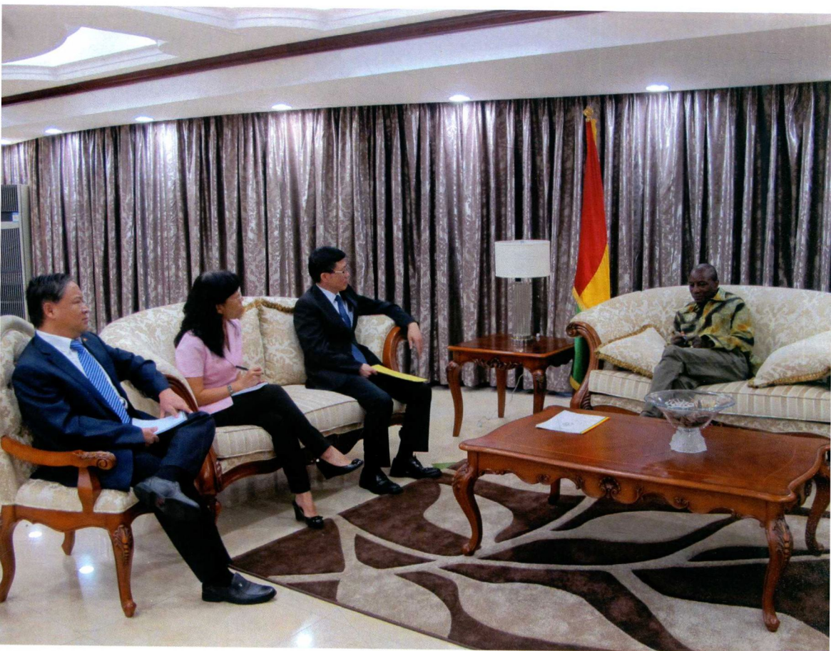
2014年8月12日，中国驻几内亚大使卞建强拜会孔戴总统，向其面交中国国家主席习近平就西非埃博拉疫情致其的慰问信。