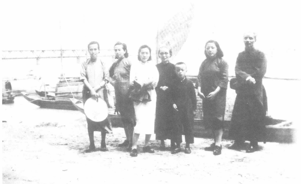
丰子恺（右一）与家人在杭州钱江大桥前留影