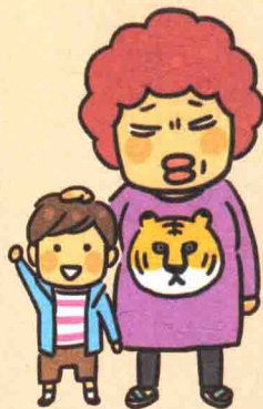
田中 佳子 (45)