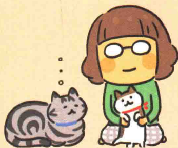
山田 真由 (28)