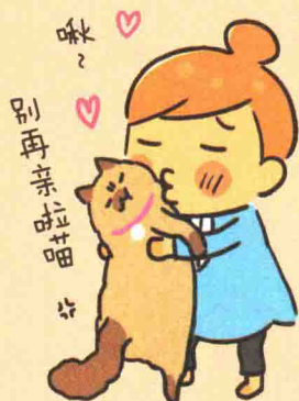
山田 由香 (30)