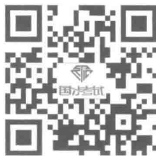
国才考试官方网站