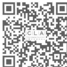
国才考试官方微信