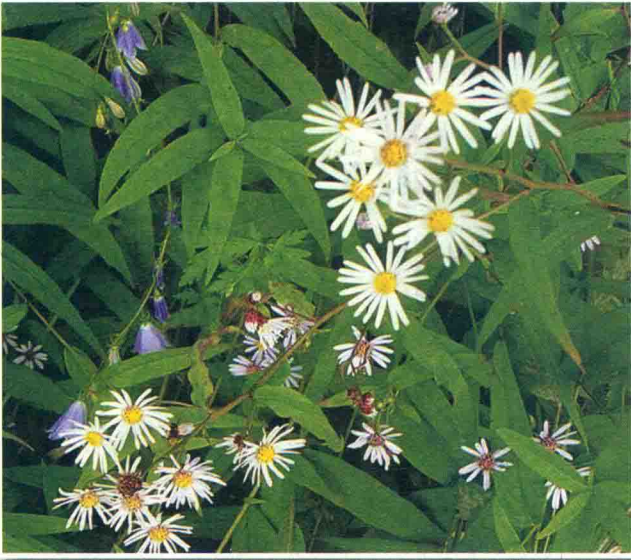
甘川紫菀 ཡུ་གུ་ཤིང་།