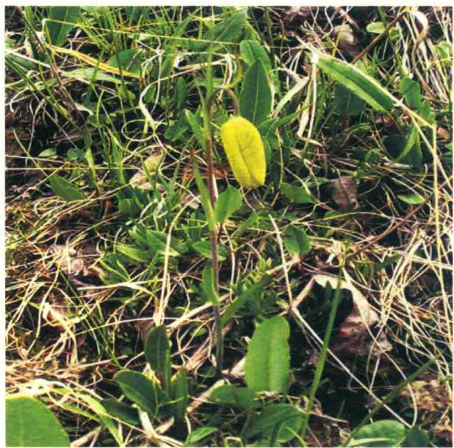
梭砂贝母 ཨ་རྩི་ཁ།