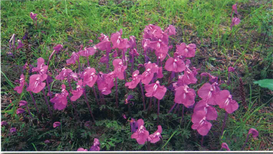
红马先蒿 ལུག་ཅུ་དམར་པོ།