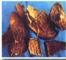
黄商陆 དཔའ་བོ་སེར་པོ།