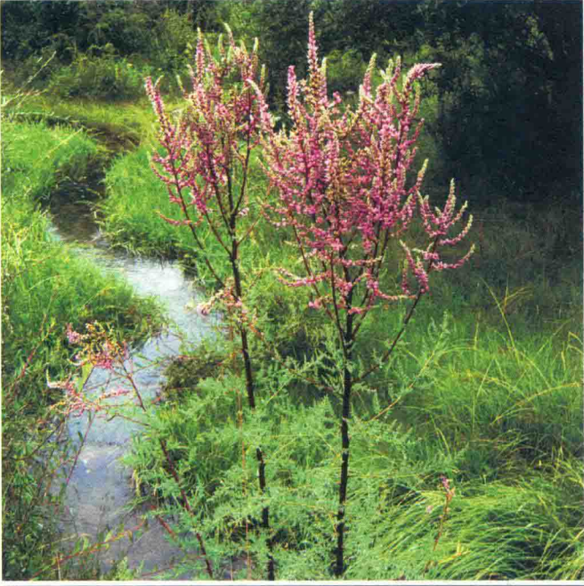
水柏枝 འོམ་བྲ།