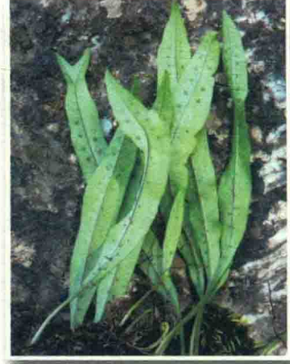
瓦韦 བྲག་སྒོས་པ།