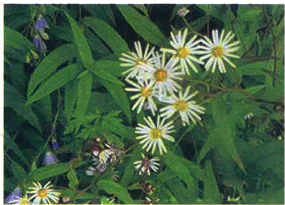
川西千里光 རིང་ཚུང་བ།