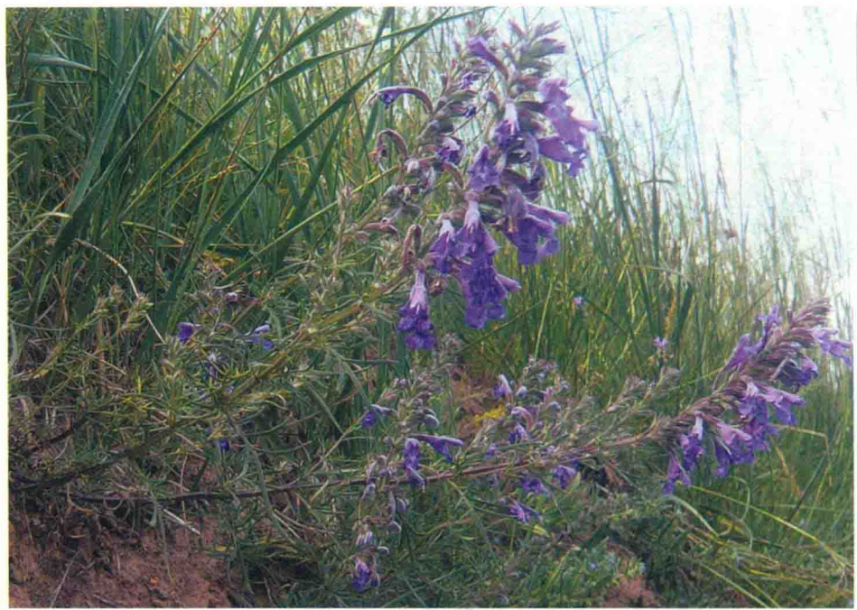
甘青青兰 འཇིབ་ཚི།