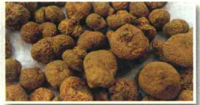
延胡索 ལྷ་མི་དམར་པོ།