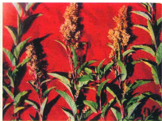
甘川紫菀 ཡུ་གུ་ཤིང་ནག་པོ།