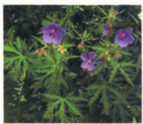
老鹤草 མ་ལུ་གླ་གླང་།