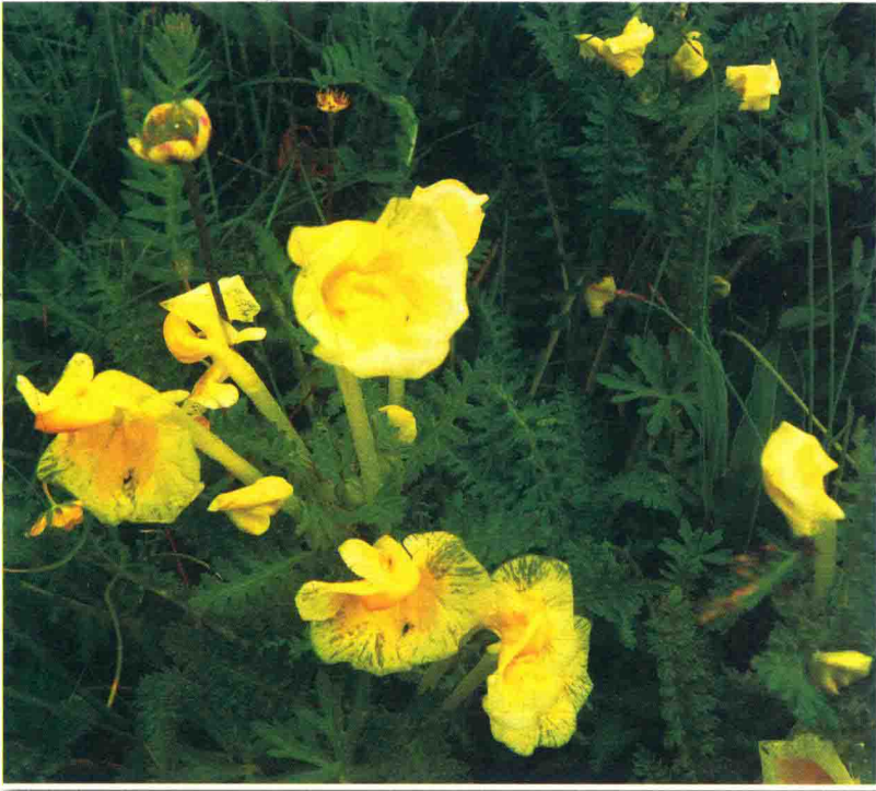
黄马先蒿 ལུག་རུ་སེར་པོ།