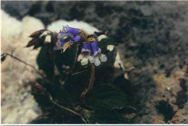
卷丝苣苔 བྲག་སྐྱ་ཏ་བོ།