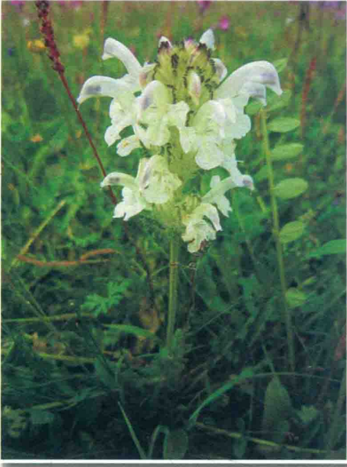
白马先蒿 ལུག་རྩ་དཀར་པོ།