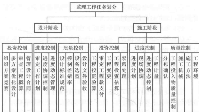
图 1-2 监理工作任务的划分

(8) 检查施工现场的安全状况，当发现重大施工质量和安全问题时，及时指出并向专业监理工程师报告，还应协同有关方面采取相应措施予以处理，并按有关规定及时报告建设单位和建设行政主管部门。