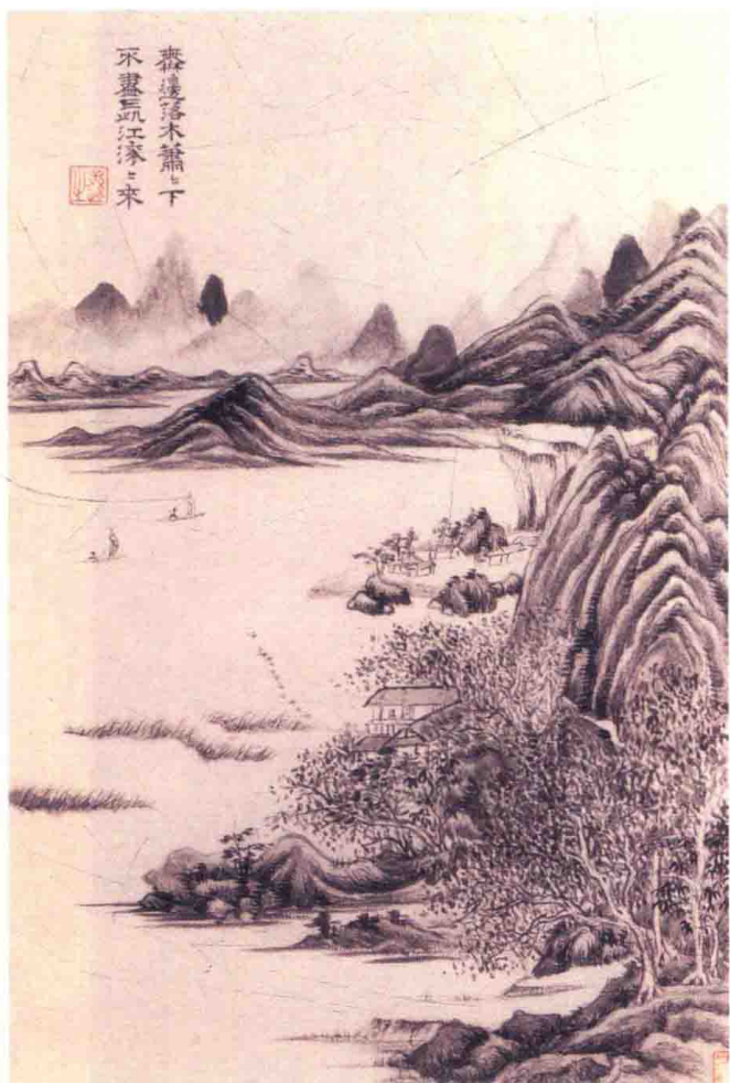
清·王时敏作 杜甫诗意图 落木江帆