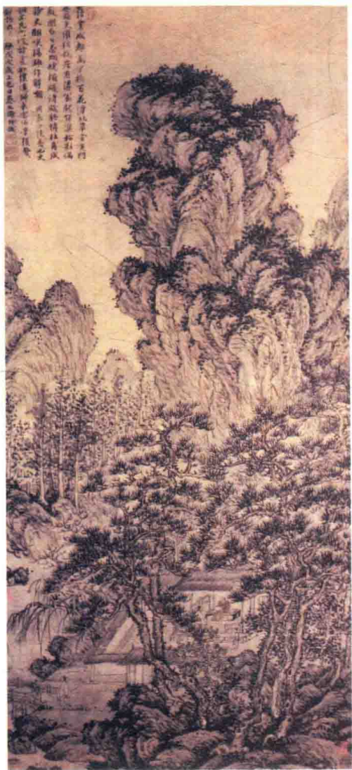
明·解缙作 少陵诗意图