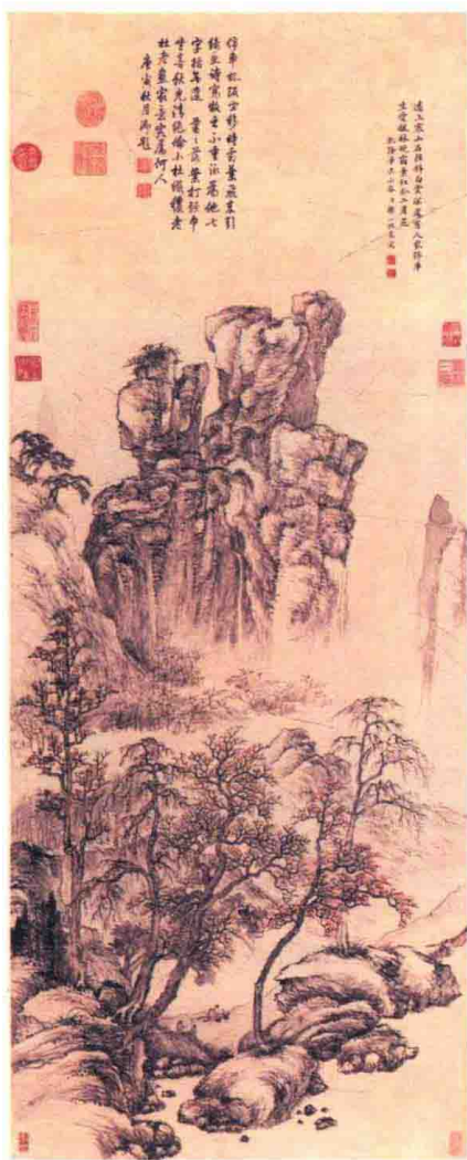
清·邹一桂作 杜牧诗意图