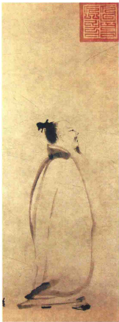
南宋·梁楷作 李白行吟图