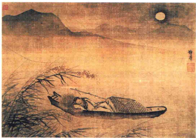
明·戴进作 月下泊舟