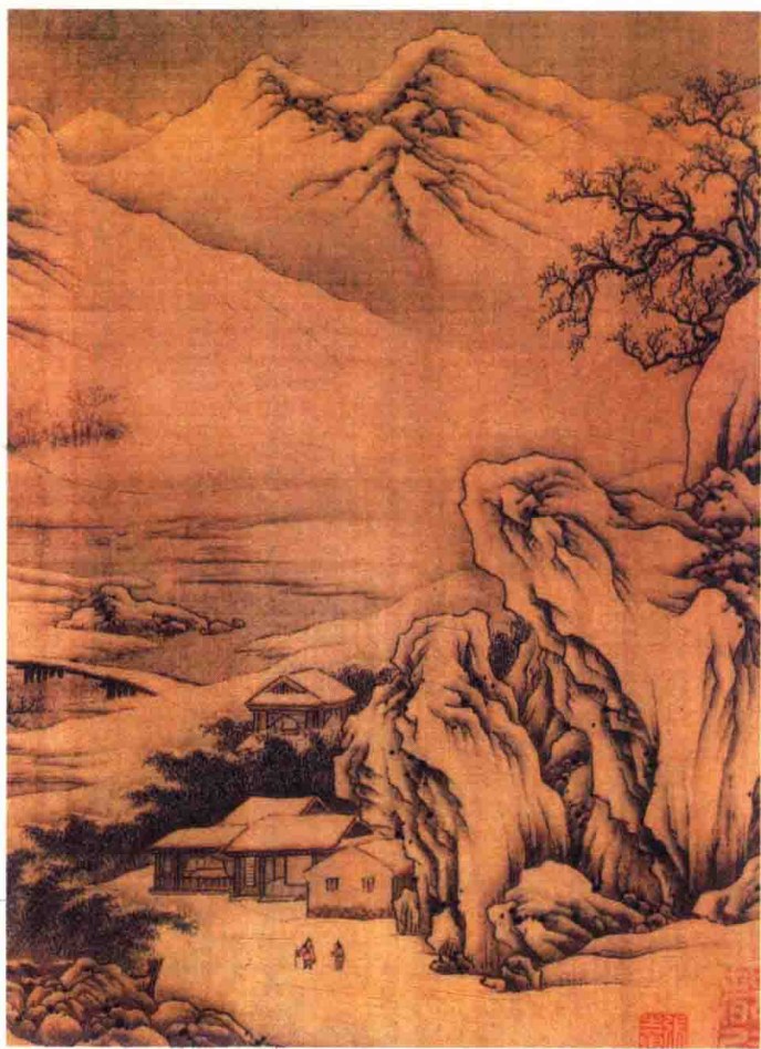
唐·王维作 江干雪霁图卷