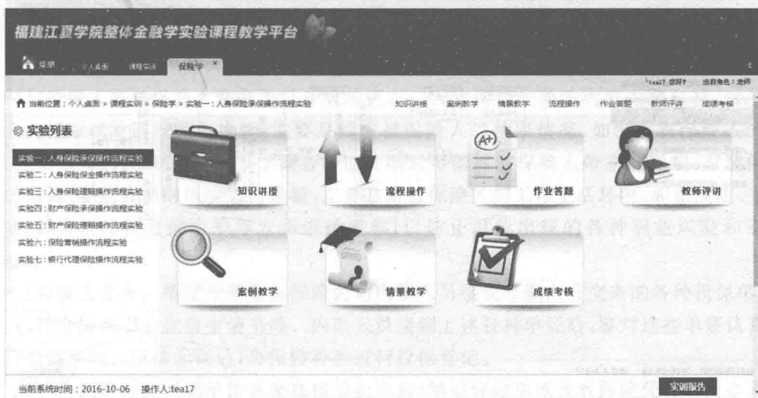
图2 保险实务实验教程实训课程的主界面

在此界面下包括全书七个实验项目的列表,每个项目下都涉及知识讲授、案例教学、流程操作、情景教学、作业答题、成绩考核等多个模块。图3所示为实验一部分的知识讲授模块界面,可按照教学进度安排进行具体内容的学习。图4所示为实验三部分的流程操作模块界面。