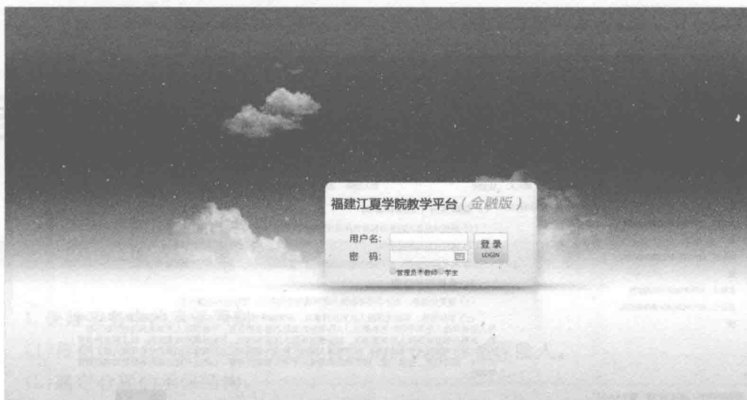
图1 教学平台登录界面