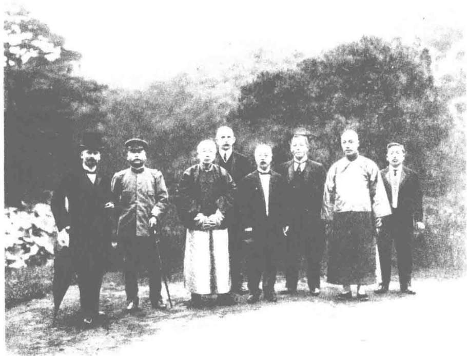
盛宣怀在日本。左起第三人为盛宣怀。