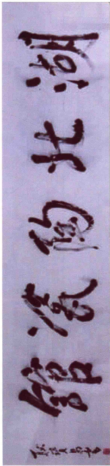
耿宝昌为湖北陶瓷馆题写馆名(高 22 厘米,长 128 厘米)

耿宝昌 :故宫博物院研究员、故宫博物院学术委员会委员、国家文物鉴定委员会副主任委员、国家文物局咨询委员会委员、中国古陶瓷学会名誉会长。被誉为“古陶瓷鉴定泰斗”。