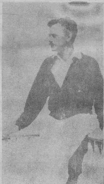
少年時代的奧尼爾。

青年時代的奧尼爾叛逆成性，曾加入「普羅溫斯頓劇團」，以對抗美國社會的物質文明和商業性演出。