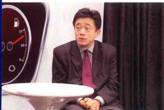
03 北京市环保局机动车排放管理处处长 李昆生