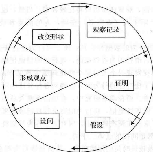
图 1-2 观察者的发现循环圈

在这个发现循环圈中，观察记录是重要的一环，它是“形成观点”和“改变现状”的前提和重要保证。